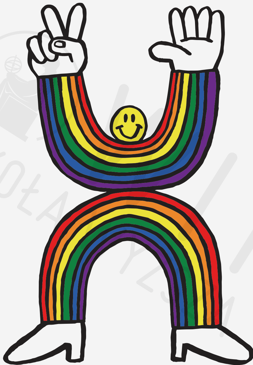
Tęczowi Ludzie druk cyfrowy, 100 x 70 cm 2020