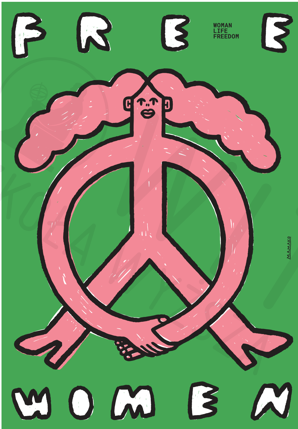
Wolne Kobiety druk cyfrowy, 100 x 70 cm 2022