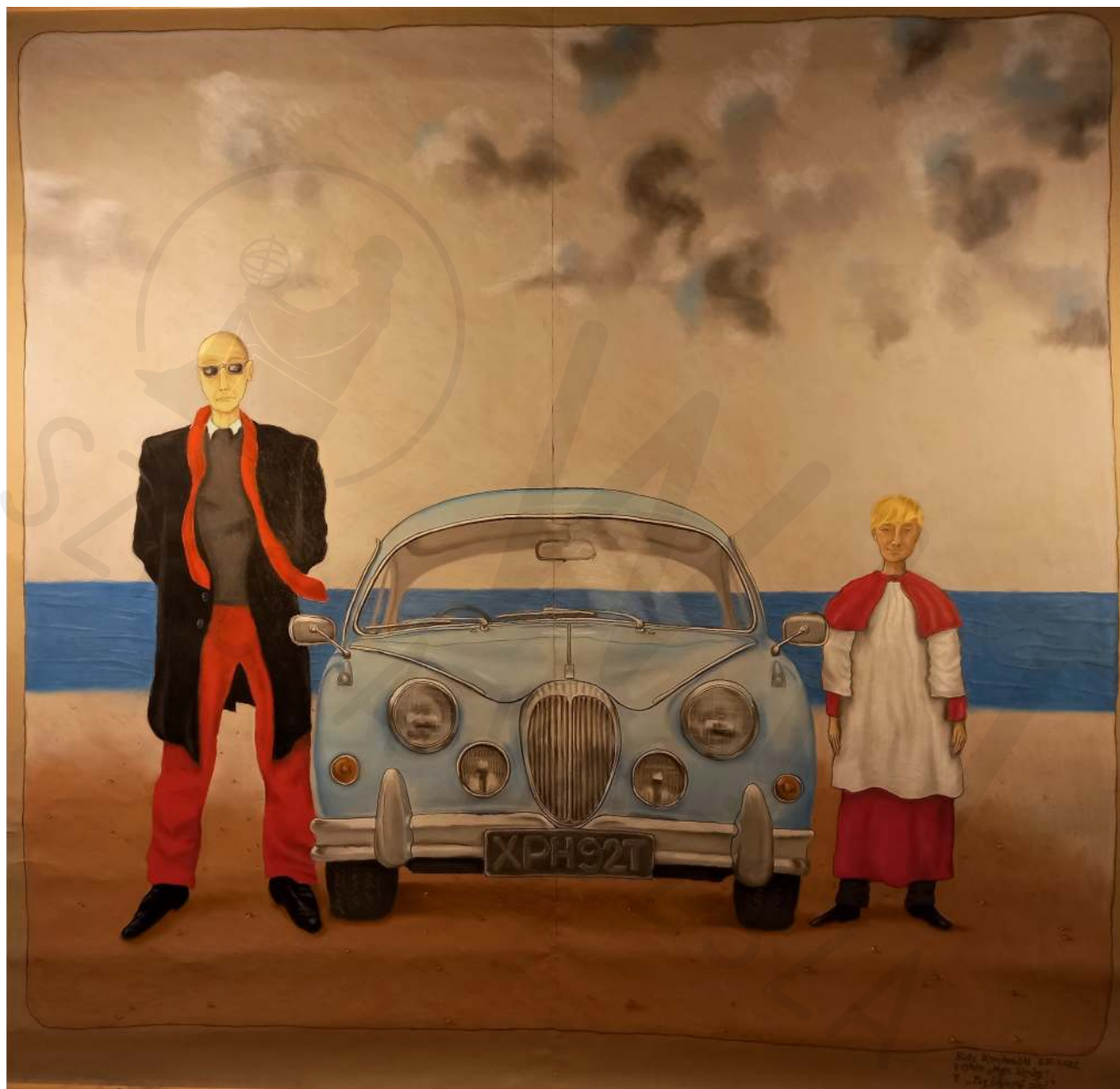
„Pięćdziesiąt pięć” (z cyklu „Moje Henley”) czarna kredka, pastele suche, cienka tektura malarska “Fifty five” (from the series “My Henley”) black crayon, soft pastels, thin painting cardboard 200 x 200 cm 2022