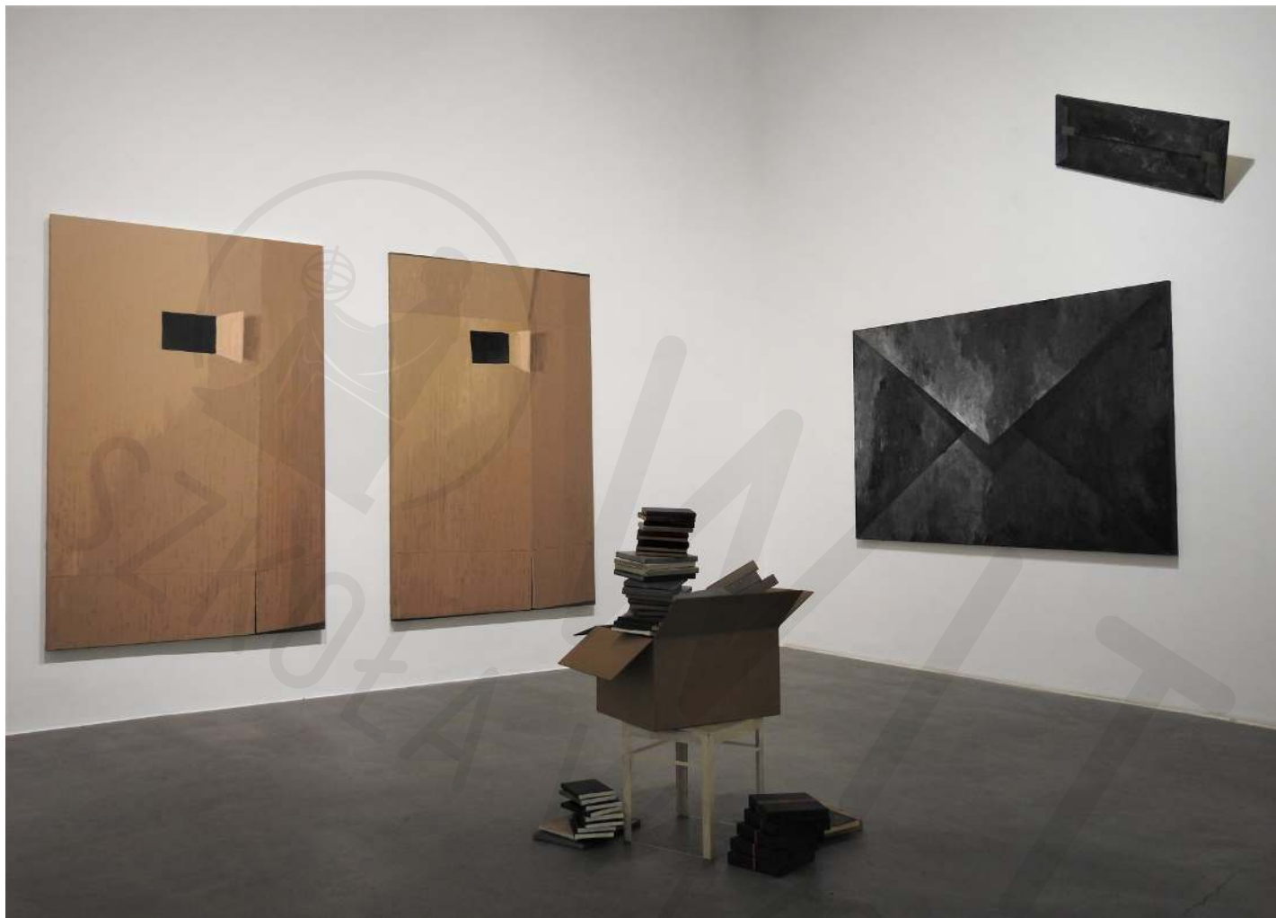
Galeria Bielska, fragment ekspozycji Bielska Gallery, fragment of the exhibition 2019