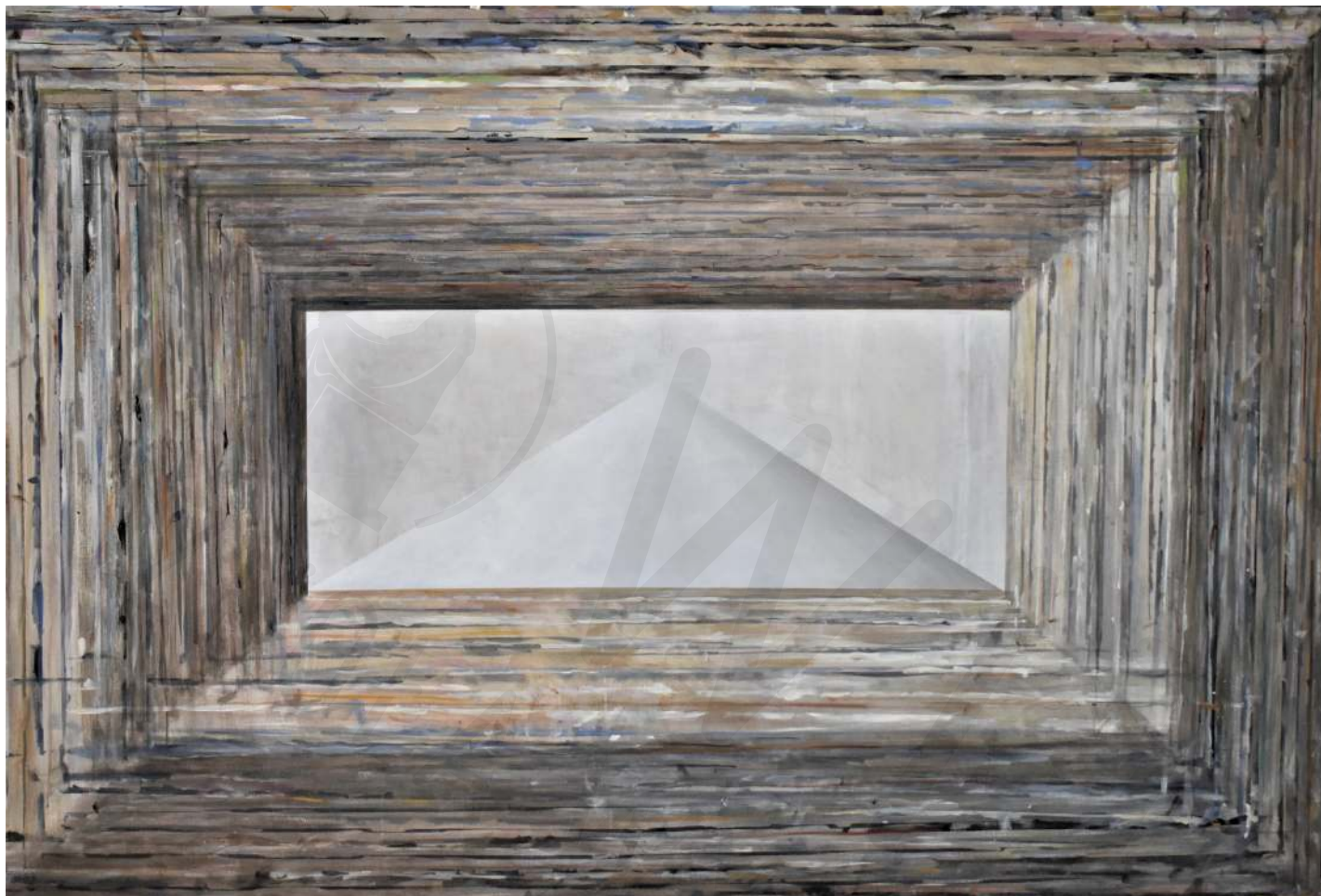
◀ Świece korek, akryl Candles cork, acrylic 60x90 cm 2020