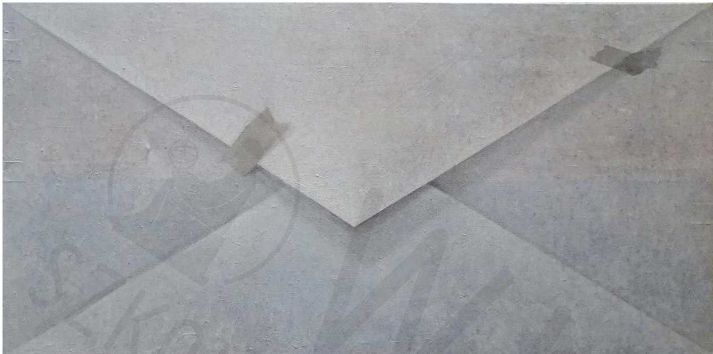
Koperta olej na płótnie Envelope oil on canvas 70x140 cm 2010