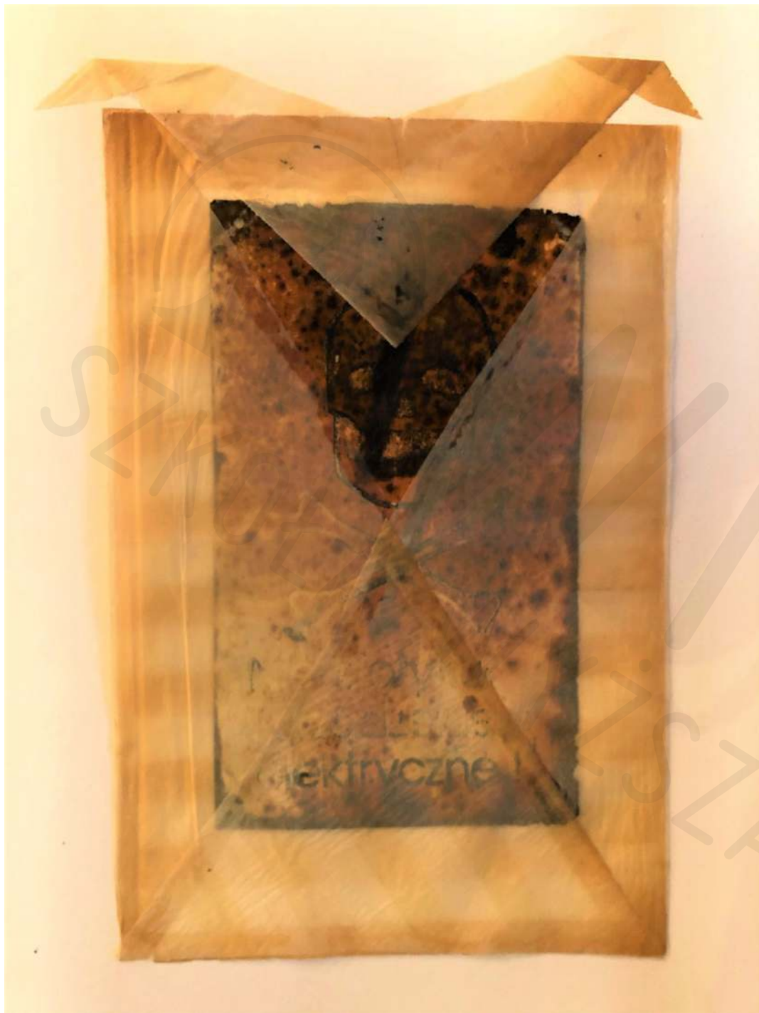
Koperta technika własna Envelope own technique 35x45 cm 2020