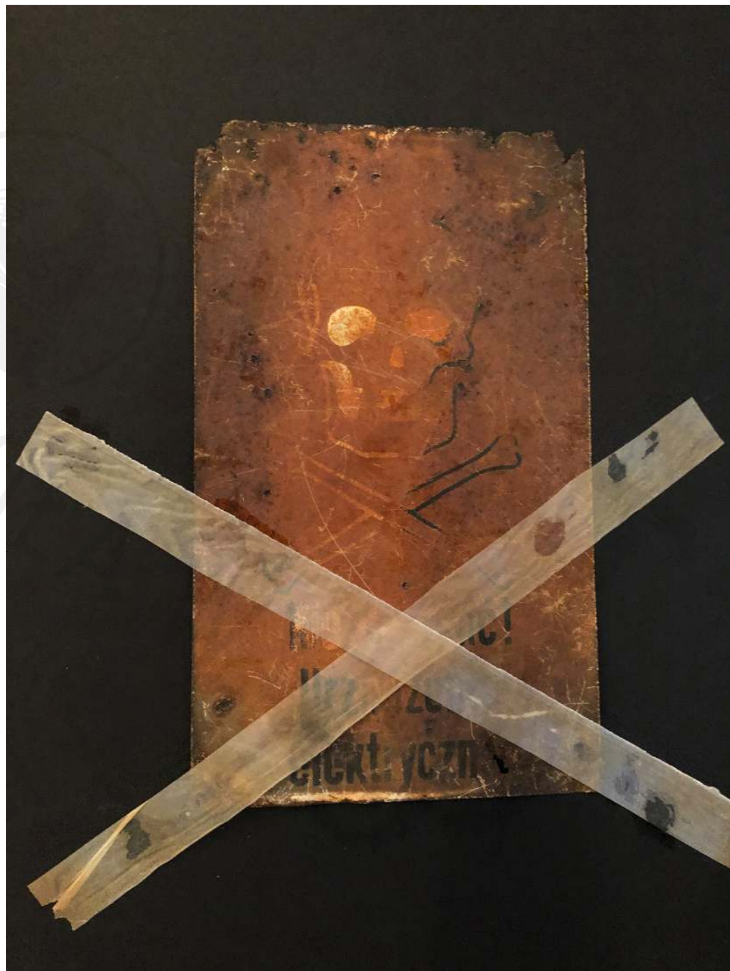
Koperta 3 technika własna Envelope 3 own technique 35x45 cm 2020