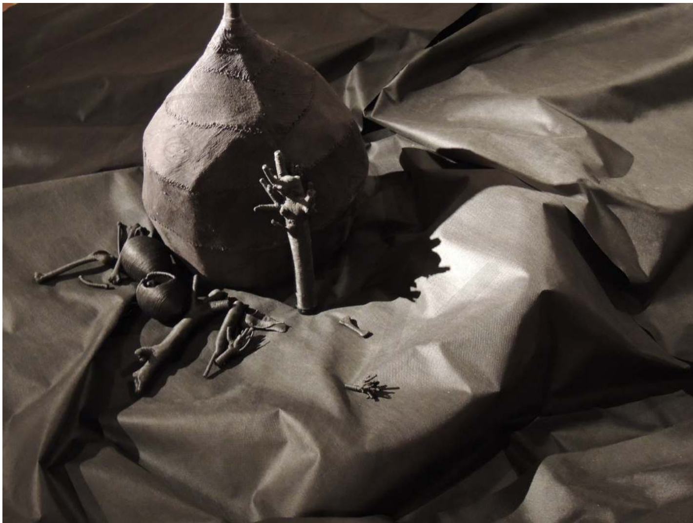
fragment wystawy „Ucieczka przed asteroidą” martwa natura z nici part of the exhibition “Escape from the asteroid” still life from thread 2014