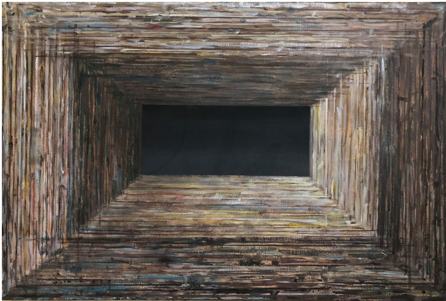
Rama Noc akryl na płótnie Rama Noc acrylic on canvas 40x60 cm 2021