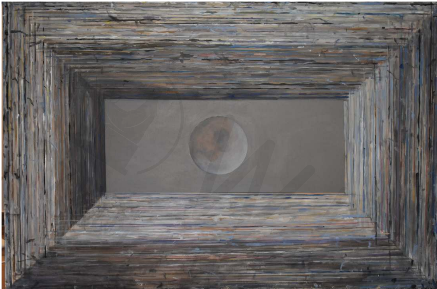
Rama z księżycem akryl na płótnie Frame with the moon acrylic on canvas 120x180 cm 2021