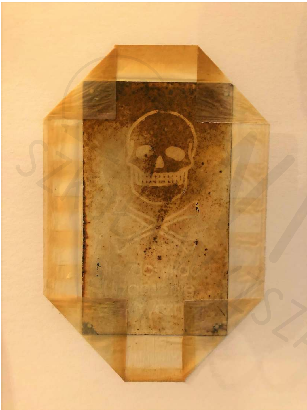
Koperta 2 technika własna Envelope 2 own technique 35x45 cm 2020