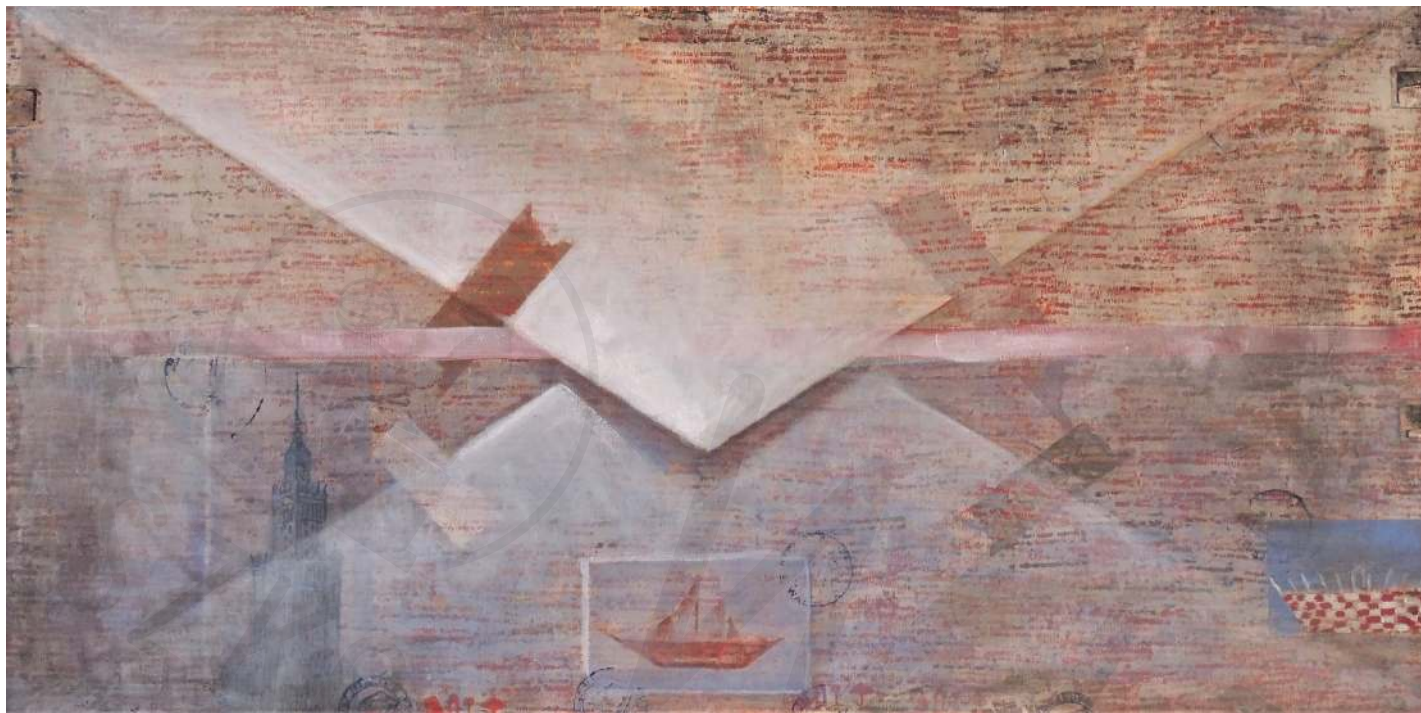
Koperta różowa olej na płótnie Pink envelope oil on canvas 60x120 cm 2019