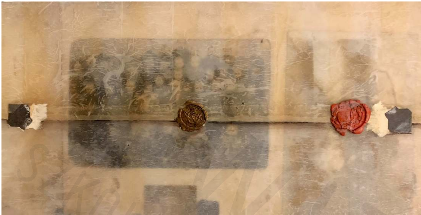
Koperta z pieczęciami technika własna Envelope with seals own technique 15x30 cm 2021