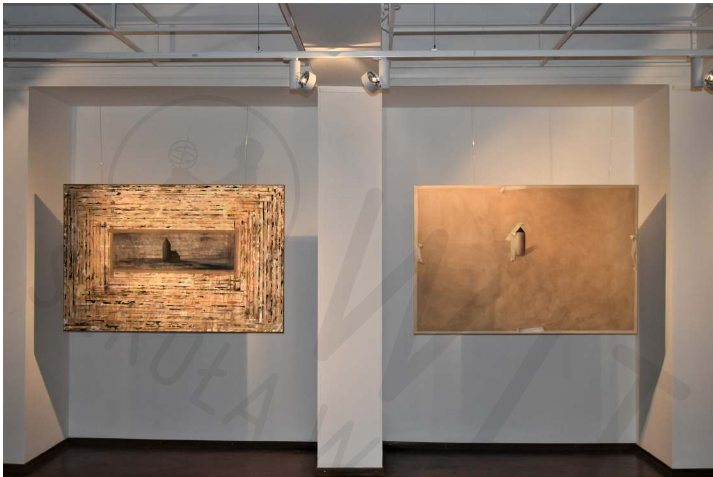
Kościołki akryl na płótnie Churches acrylic on canvas 100x150 cm 2020