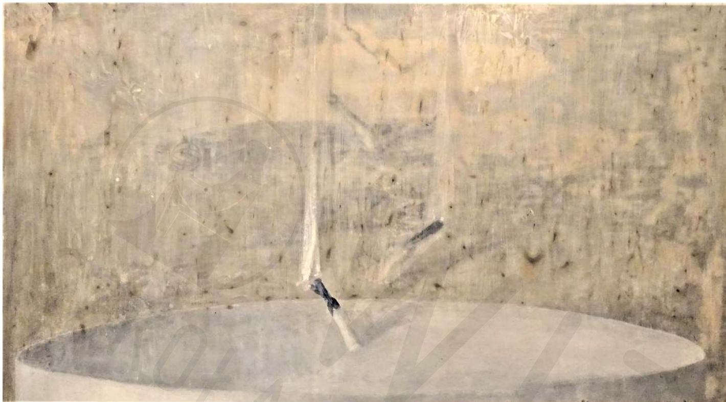
Świeca akryl na pleksi Candle acrylic on plexiglass 100x160 cm 2020