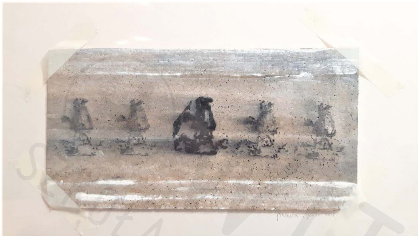
List korek akryl Letter cork acrylic 15x30 cm 2020