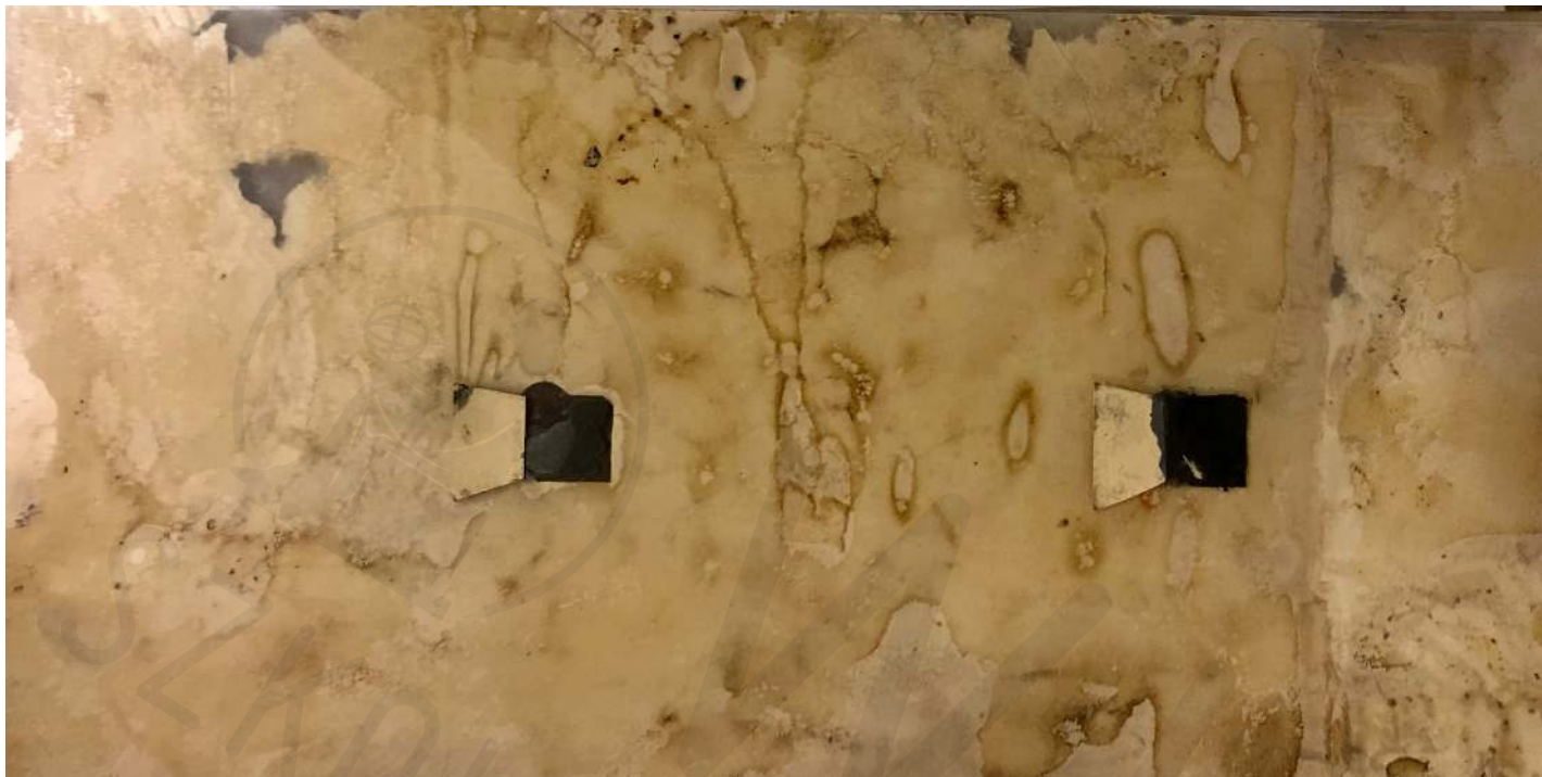
Okienka akryl pleksi Windows acrylic plexiglass 15x30 cm 2020