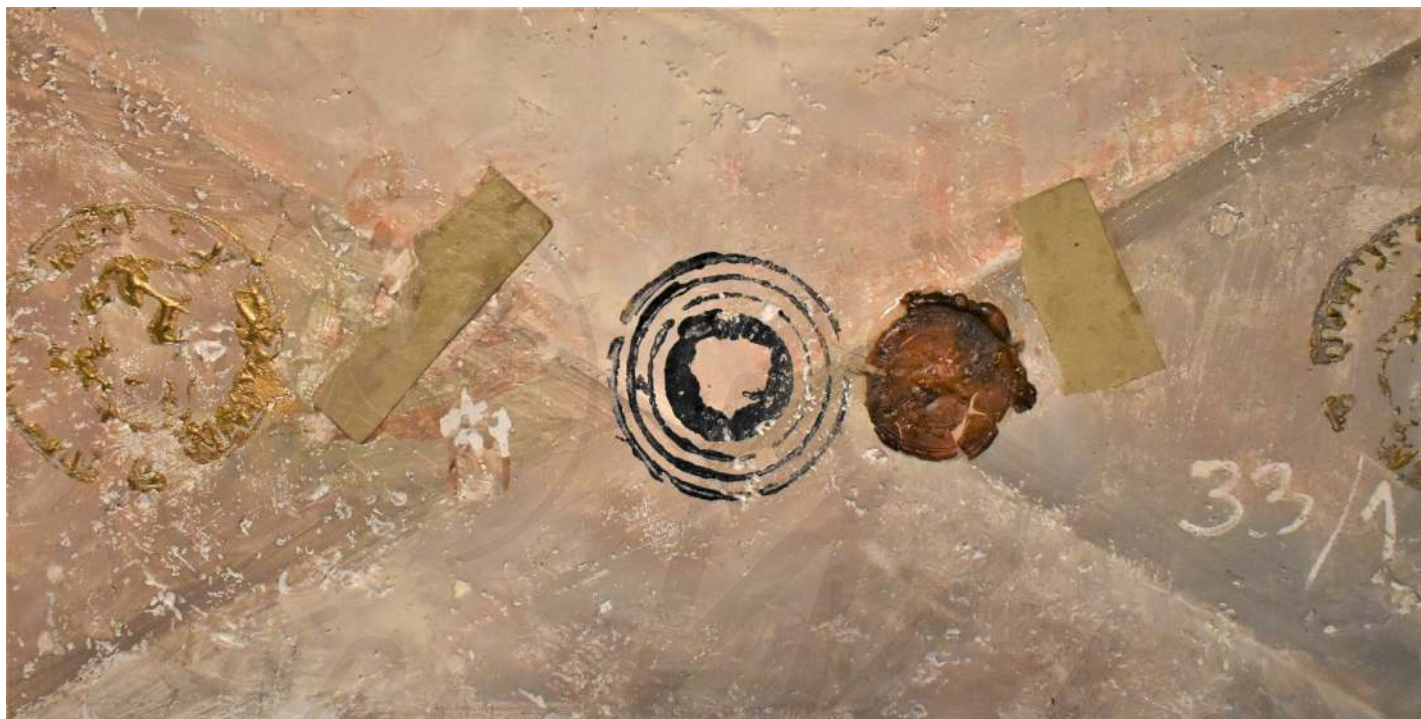
◀ Koperta ze stemplem 2 akryl na korku Envelope with stamp 2 acrylic on cork 15x30 cm 2019