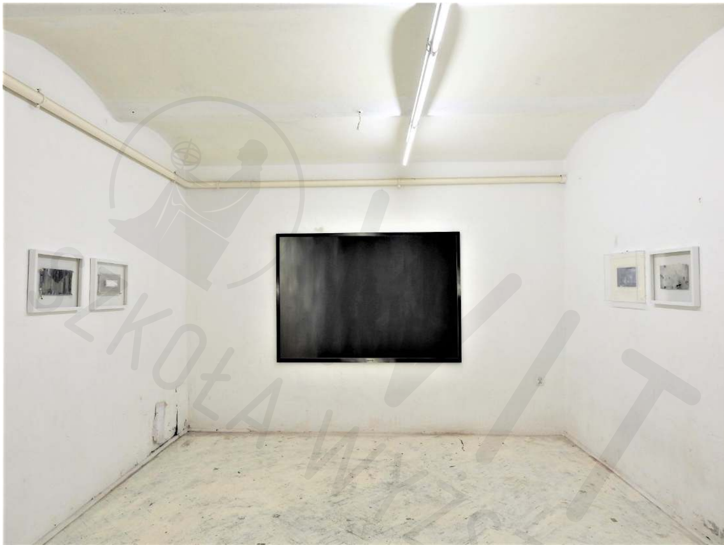
◀ Galeria Bielska, fragment ekspozycji Bielska Gallery, fragment of the exhibition 2019