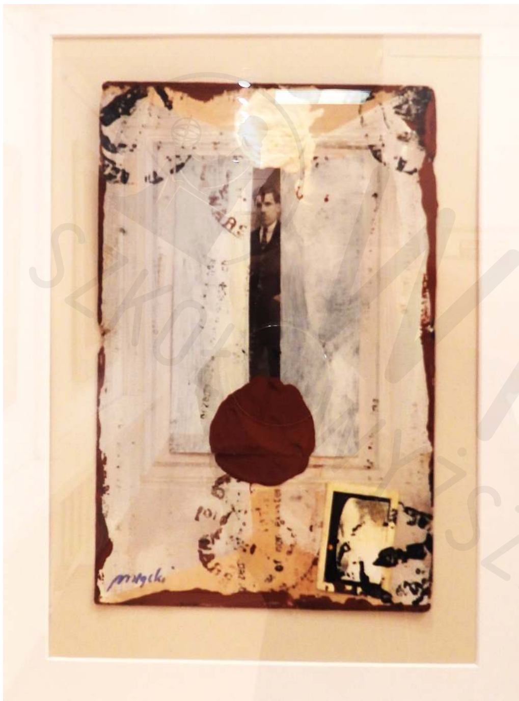
Koperta Bułgarska technika własna Bulgarian Envelope own technique 20 x 30 cm 2022