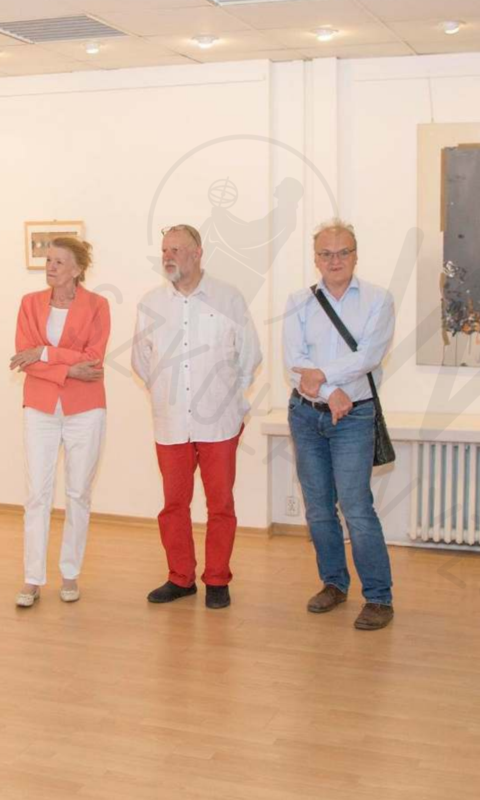
Instytut Bułgarski 2022 fragment wystawy Bulgarian Institute 2022 fragment of the exhibition 2022