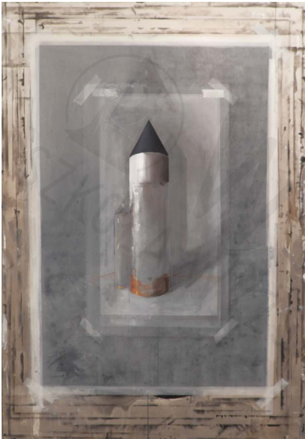
Wieża olej, akryl na płótnie Tower oil, acrylic on canvas 135x185 cm 2016