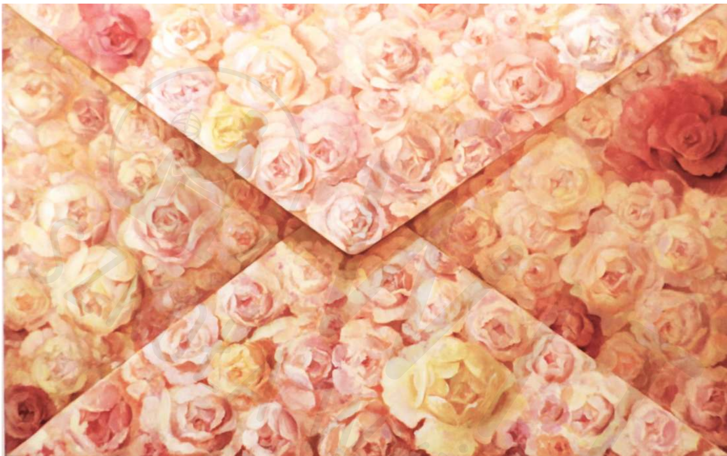
Koperta z róż olej na płótnie Roses envelope oil on canvas 140 x 220 cm 2022