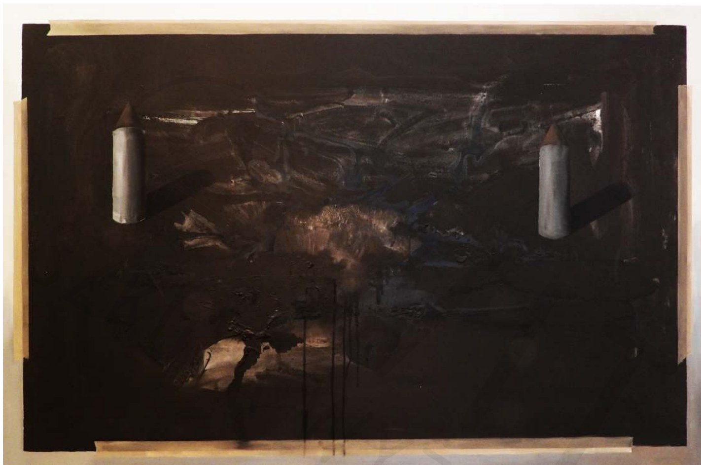
Dwie wieże olej na płótnie Two towers oil on canvas 135 x 185 cm 2017