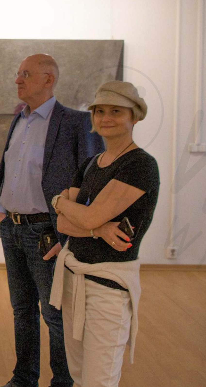
Instytut Bułgarski 2022 fragment wystawy Bulgarian Institute 2022 fragment of the exhibition 2022