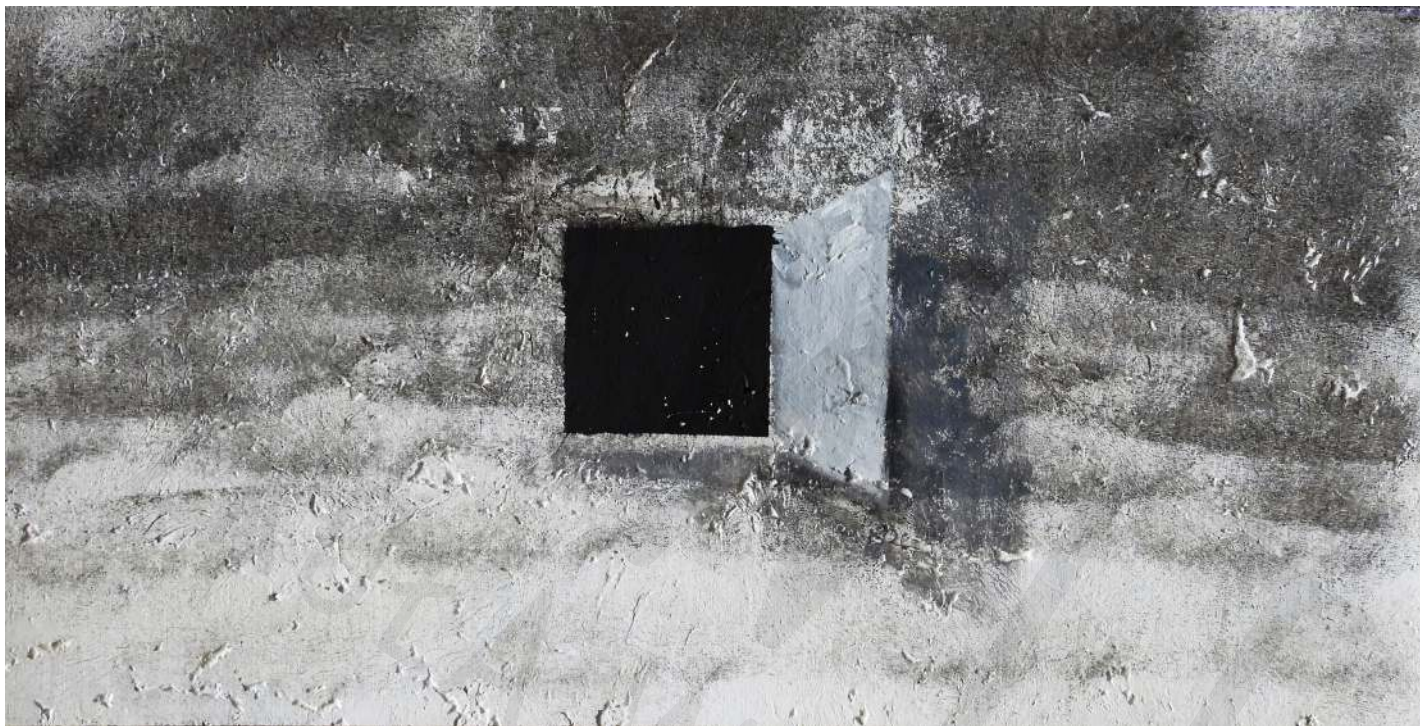
Koperta 37 korek, akryl Envelope 37 cork, acrylic 15 x 30 cm 2022