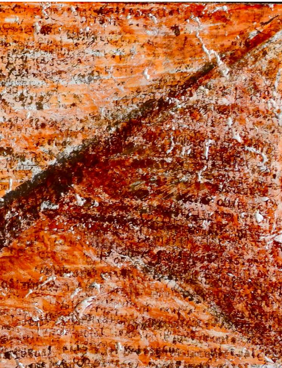
Koperta 34 korek, akryl Envelope 34 cork, acrylic 15 x 30 cm 2022