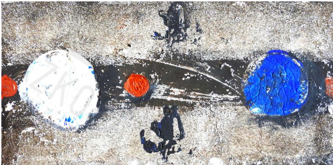
Koperta 30 korek, akryl Envelope 30 cork, acrylic 15 x 30 cm 2022