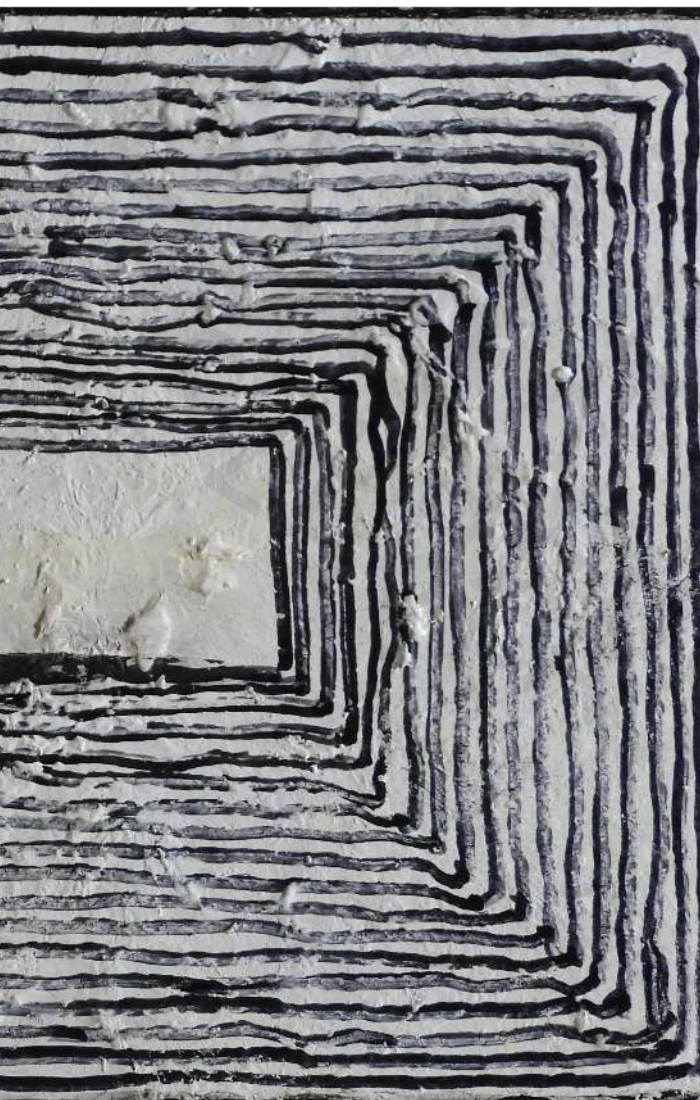
Ramka 2 korek, akryl Frame 2 cork, acrylic 15 x 30 cm 2022