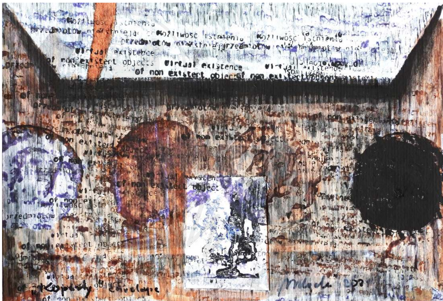
Koperta 41 korek, akryl Envelope 41 cork, acrylic 20 x 30 cm 2022