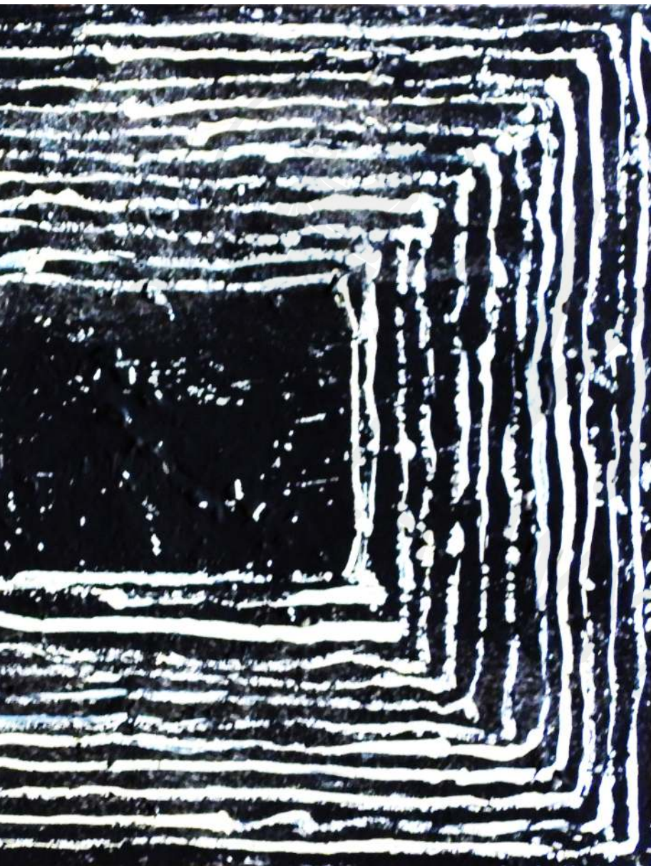
Ramka 1 korek, akryl Frame 1 cork, acrylic 15 x 30 cm 2022