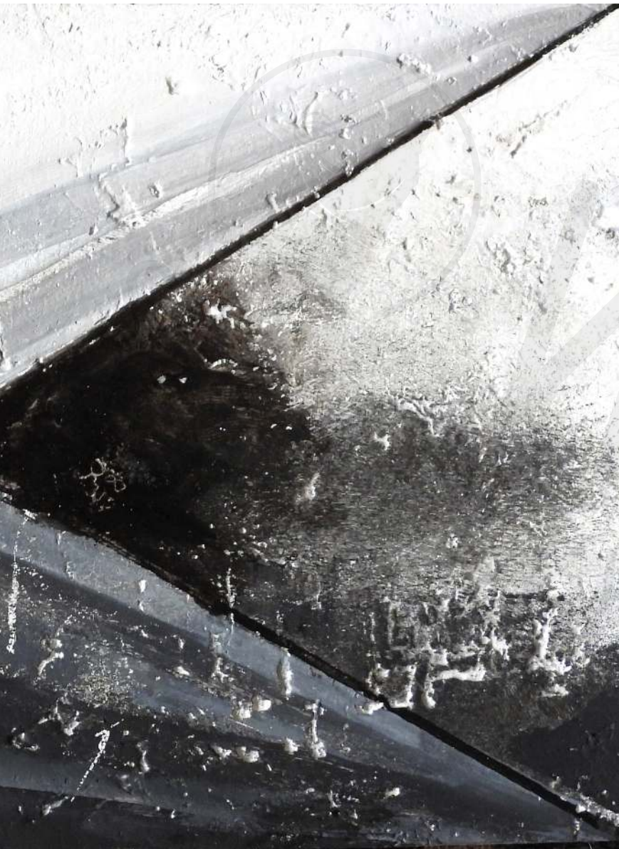
Koperta 36 korek, akryl Envelope 36 cork, acrylic 15 x 30 cm 2022