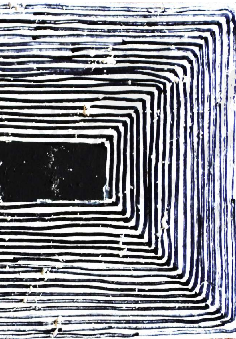
Ramka 3 korek, akryl Frame 3 cork, acrylic 15 x 30 cm 2022