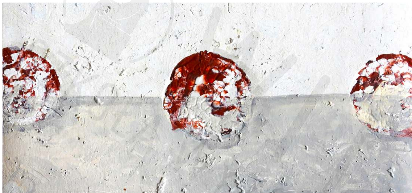
Koperta 32 korek, akryl Envelope 32 cork, acrylic 15 x 30 cm 2022