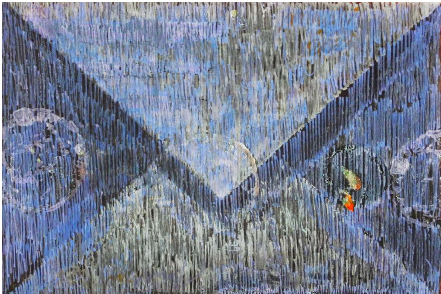
Koperta 40 korek, akryl Envelope 40 cork, acrylic 20 x 30 cm 2022