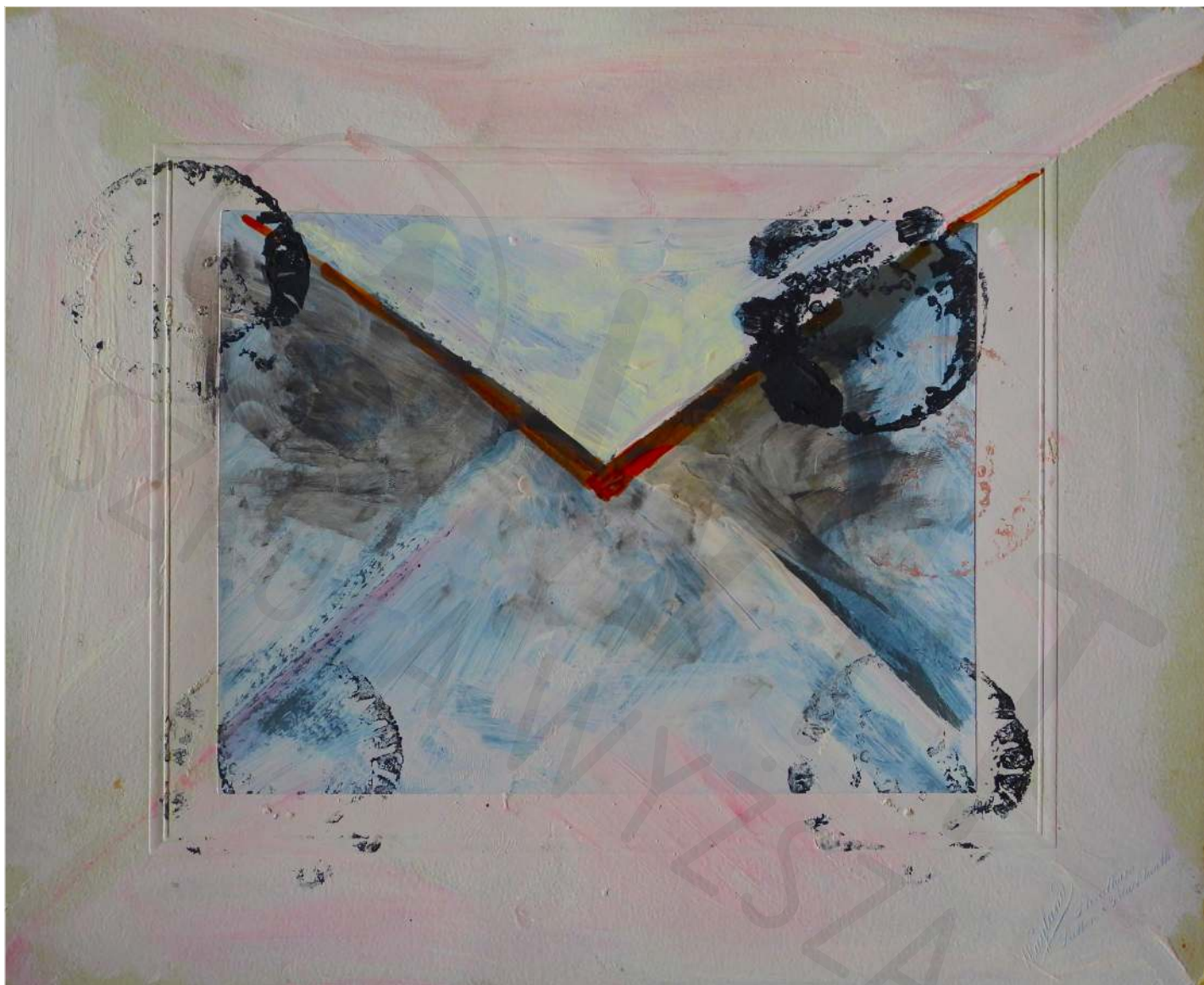
Koperta 38 korek, akryl Envelope 38 cork, acrylic 20 x 30 cm 2022