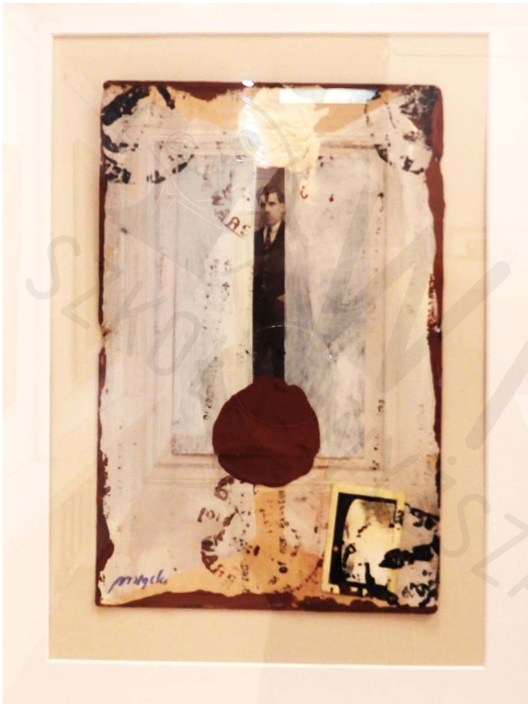
Koperta Bułgarska technika własna Bulgarian Envelope own technique 20 x 30 cm 2022