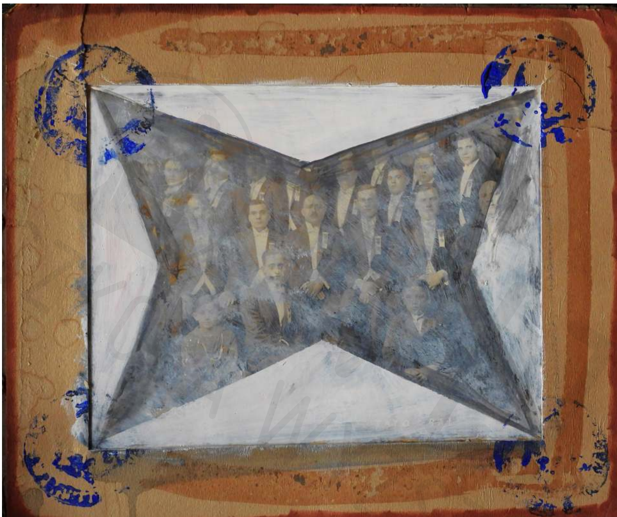
Koperta 39 korek, akryl Envelope 39 cork, acrylic 15 x 30 cm 2022