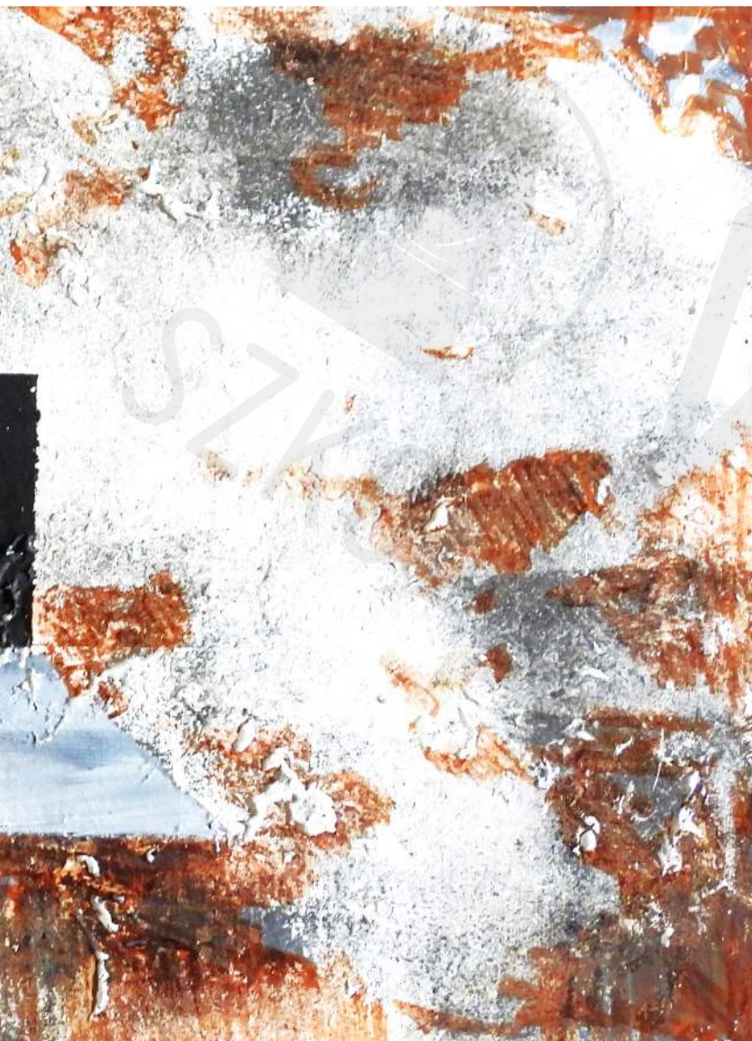
Koperta 35 korek, akryl Envelope 35 cork, acrylic 15 x 30 cm 2022