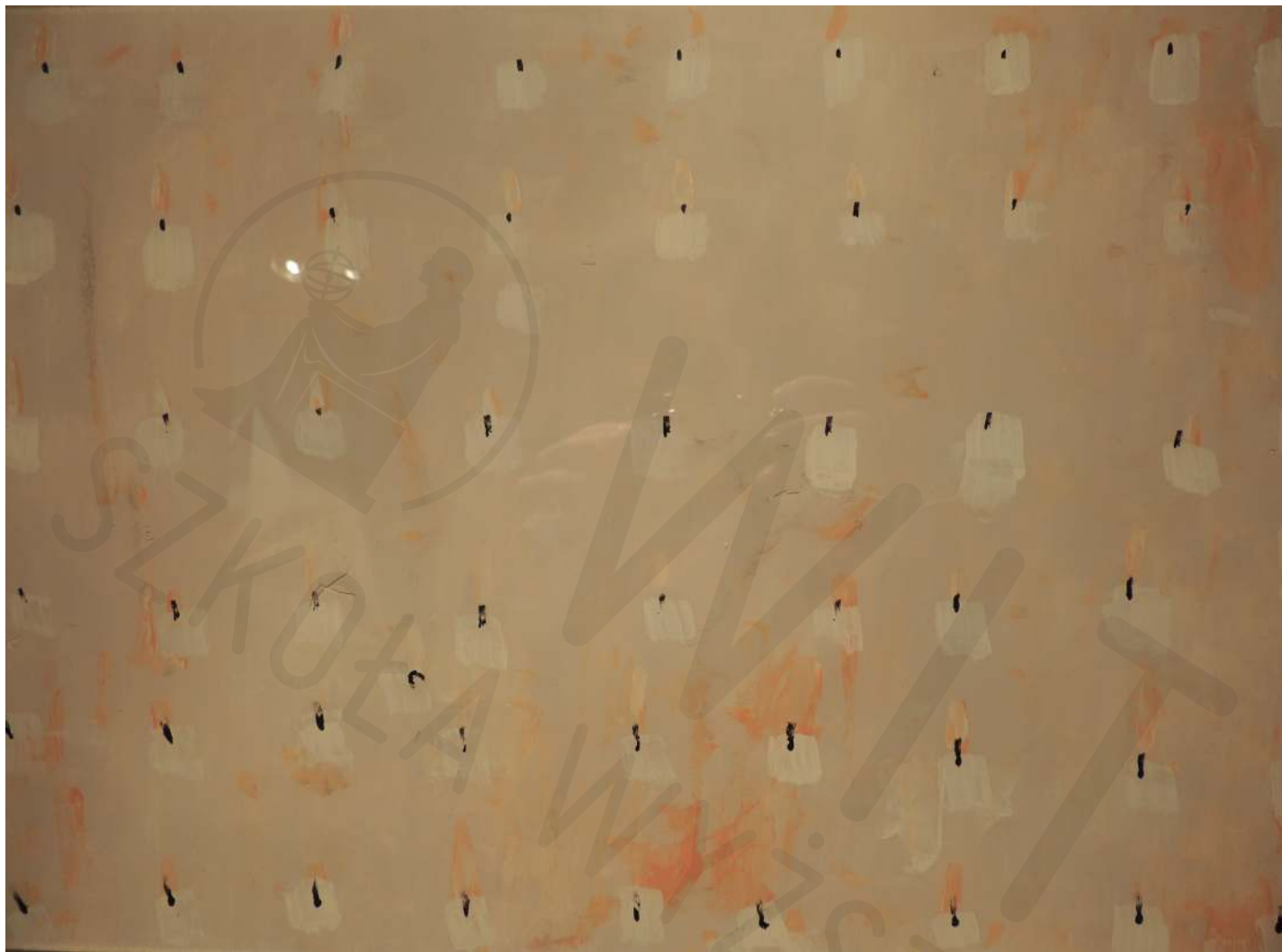
Świece 7 olej na pleksi 30x60 2020