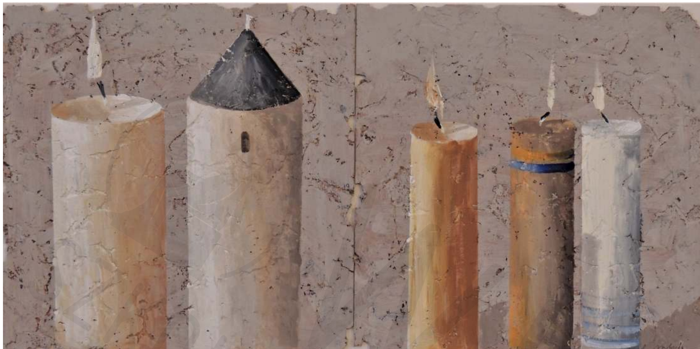
Świece 6 olej na korku 30x60 2020 Candles 6 oil on cork 30x60 2020