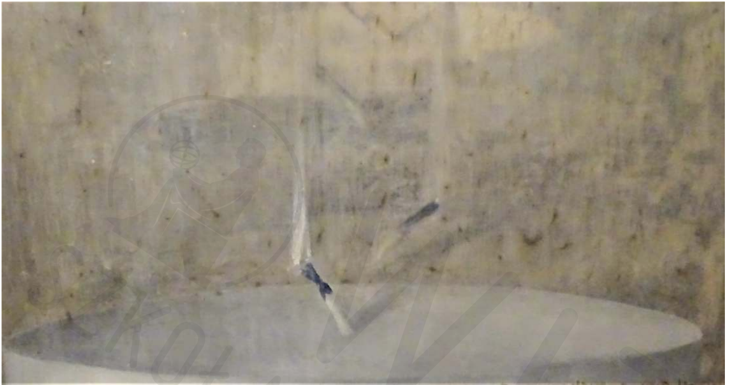
Świeca akryl na pleksi 100x160 2020

Candle acrylic on plexiglass 100x160 2020