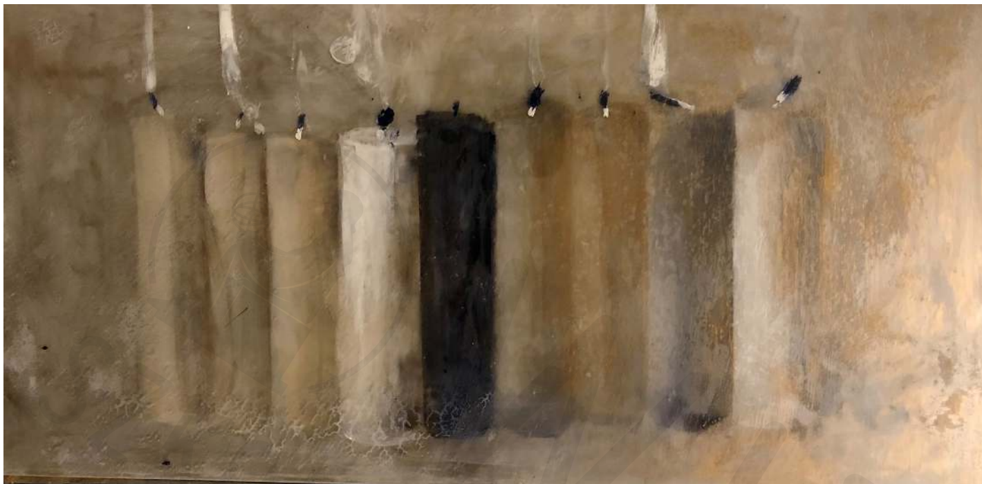
Świece akryl, olej na pleksi 15x30 2020

Candles acrylic, oil on plexiglass 15x30 2020