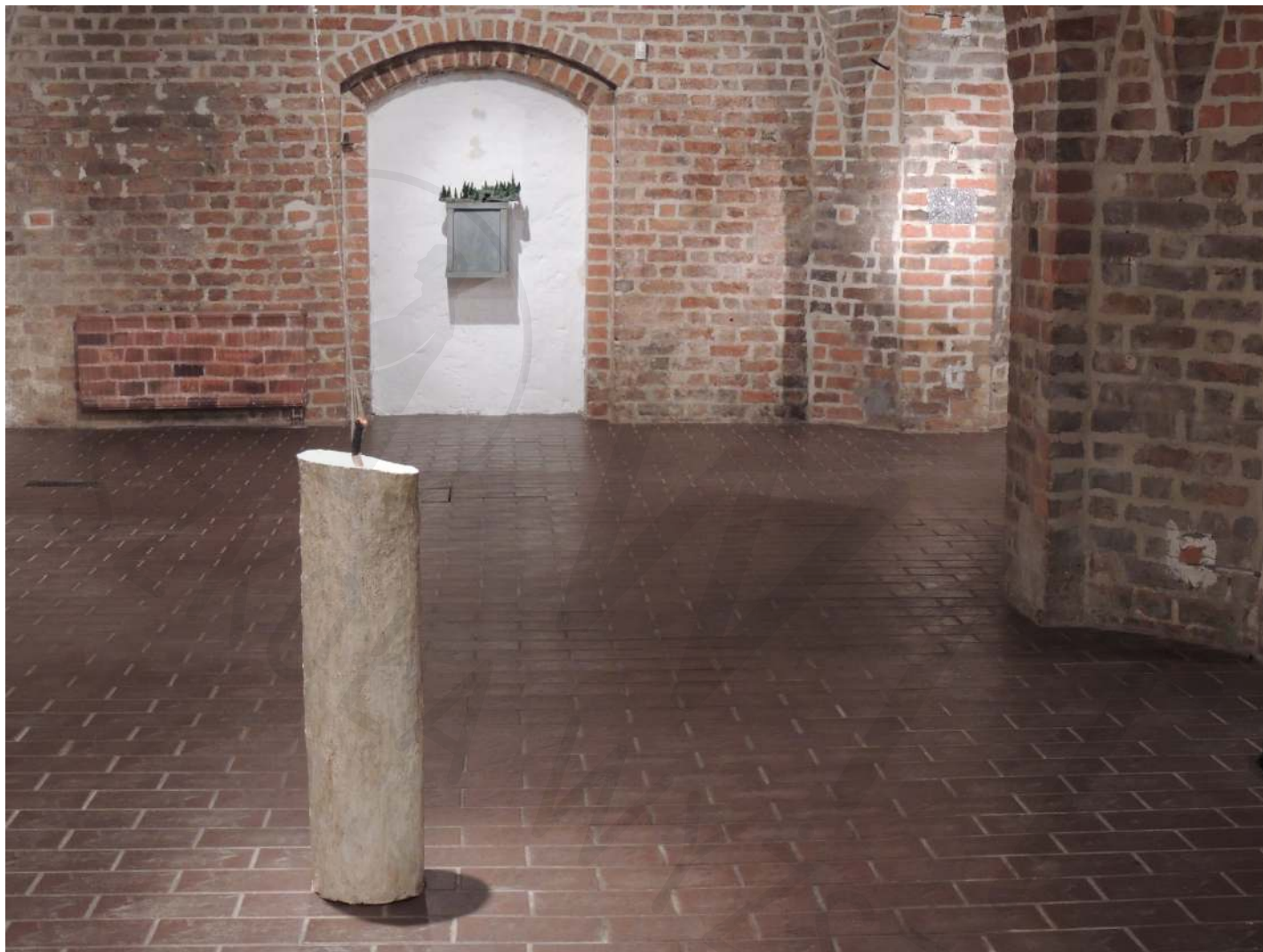
Świeca Galeria Gotycka w Szczecinie 2013 Candle Gothic Gallery in Szczecin 2013