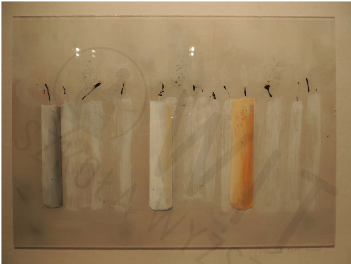
Świece olej na pleksi 30x60 2020 Candles oil on plexiglass 30x60 2020