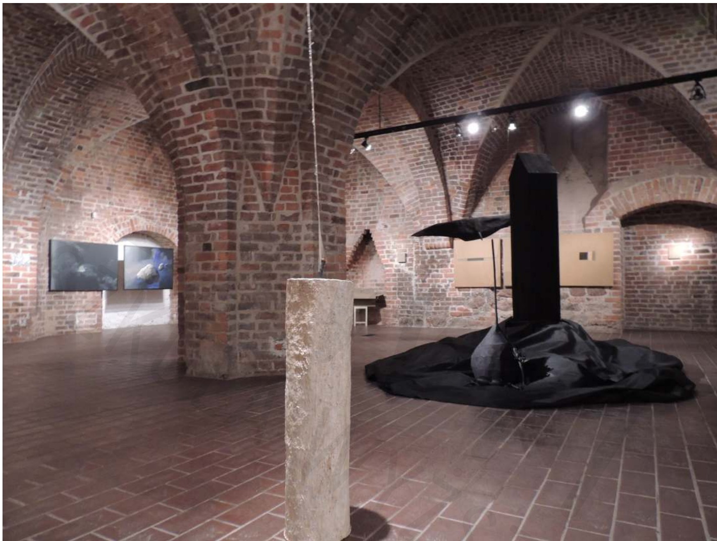
Świeca Galeria Gotycka w Szczecinie 2013 Candle Gothic Gallery in Szczecin 2013