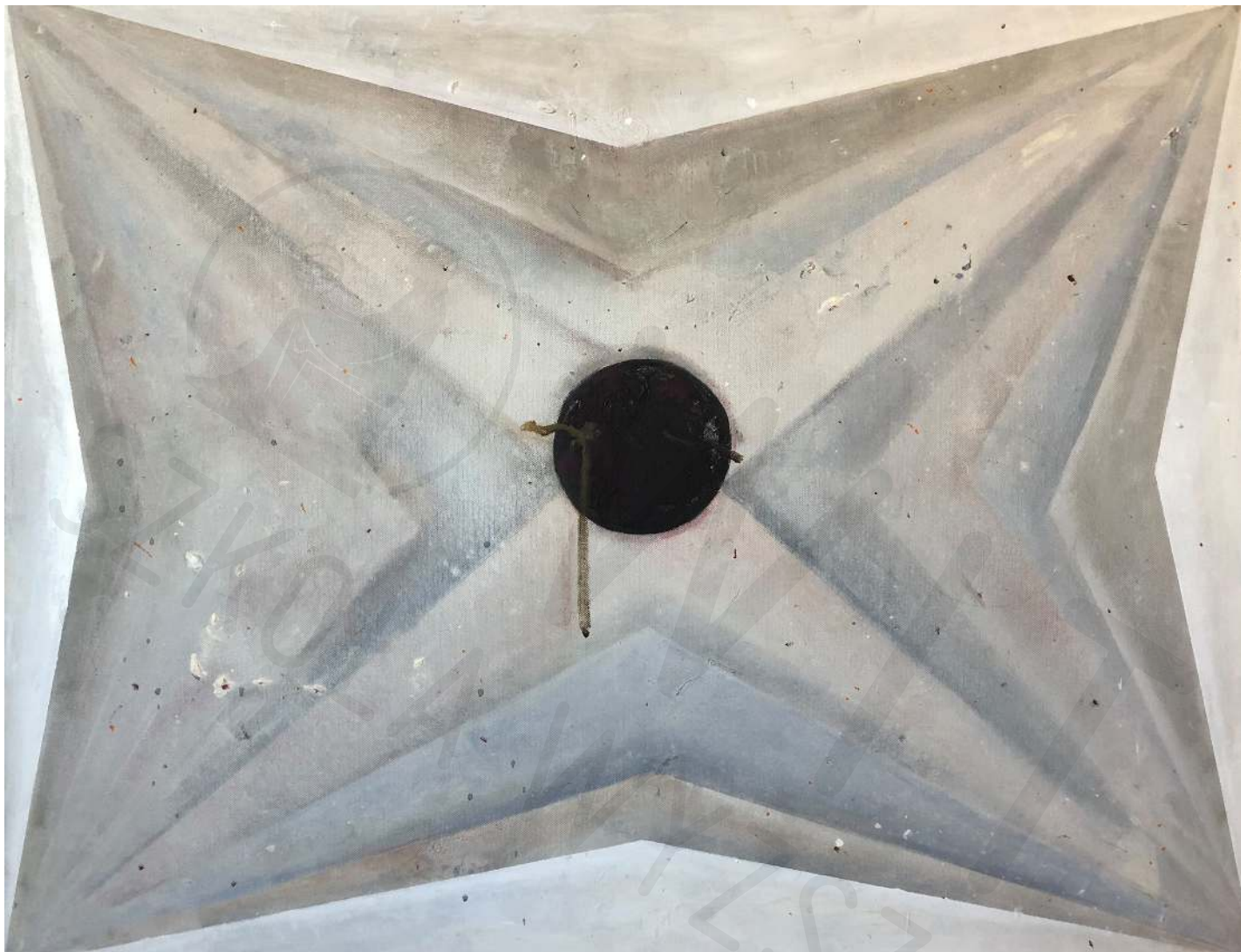
Koperta z peczcią akryl na pleksi 100x70 2020

Envelope with a stamp acrylic on plexiglass 100x70 2020