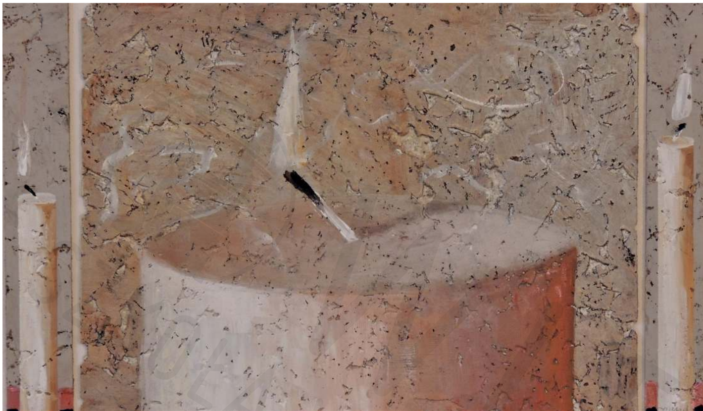
Świece 5 olej na korku 30x60 2020