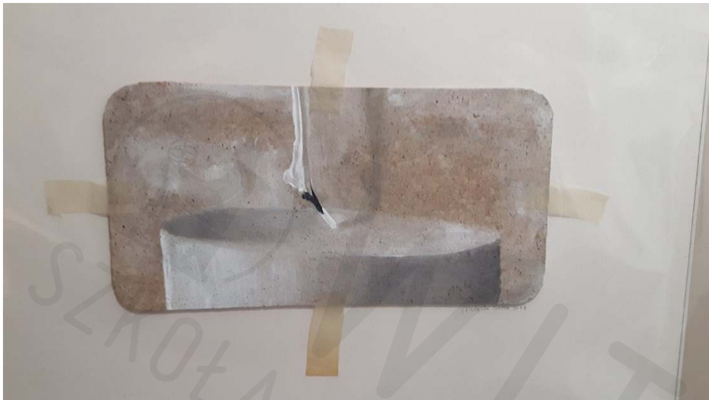
Świeca akryl na korku 20x30 2020 Candle acrylic on cork 20x30 2020