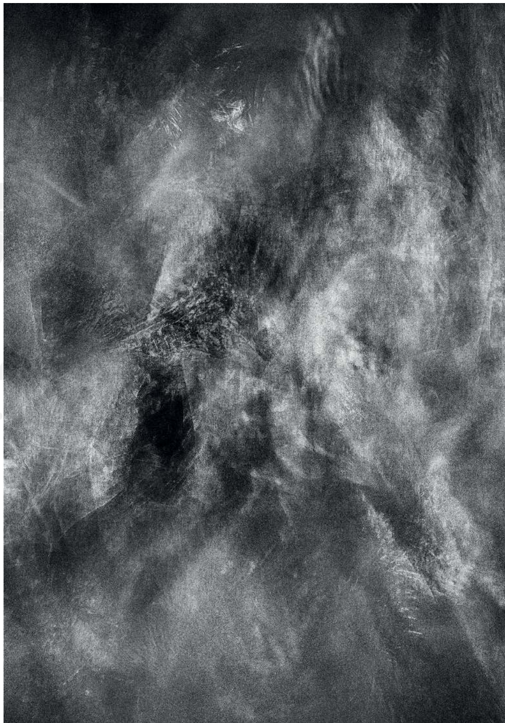
Kondensacja 10, 2020 druk pigmentowy Condensation 10, 2020 pigment printing, 100x70cm