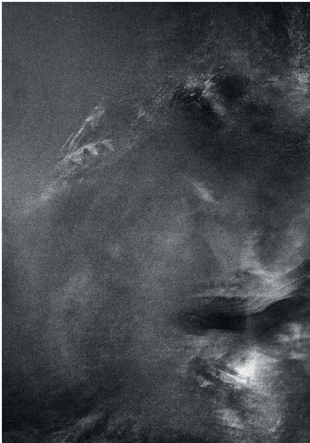
Kondensacja 11/2, 2020 druk pigmentowy Condensation 11/2, 2020 pigment printing, 100x70cm