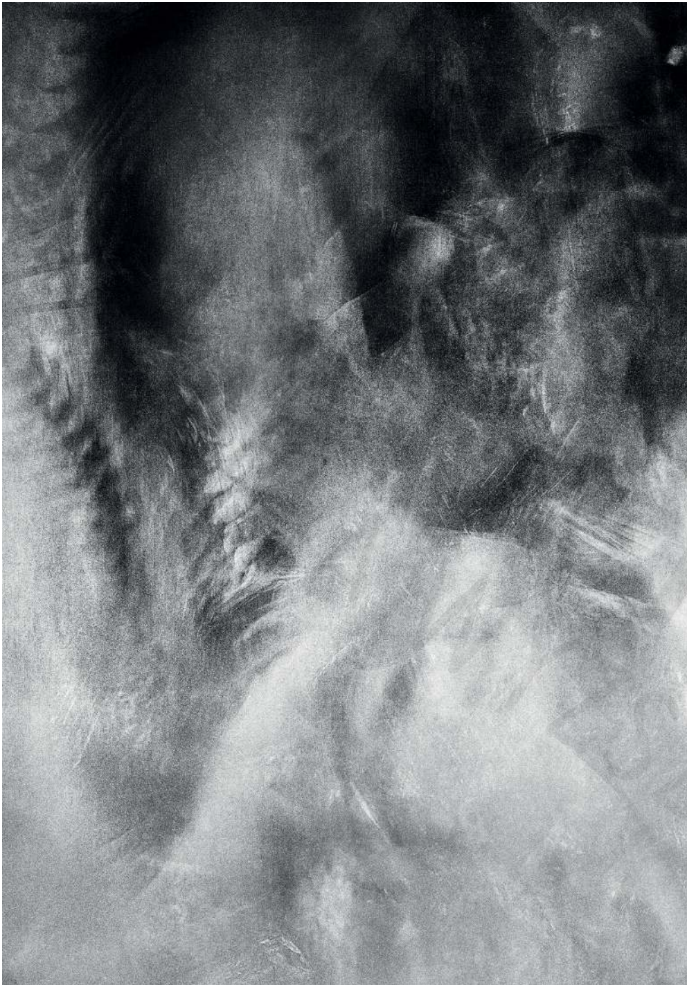
Kondensacja 06/2, 2020 druk pigmentowy

Condensation 06/2, 2020 pigment printing, 100x70cm