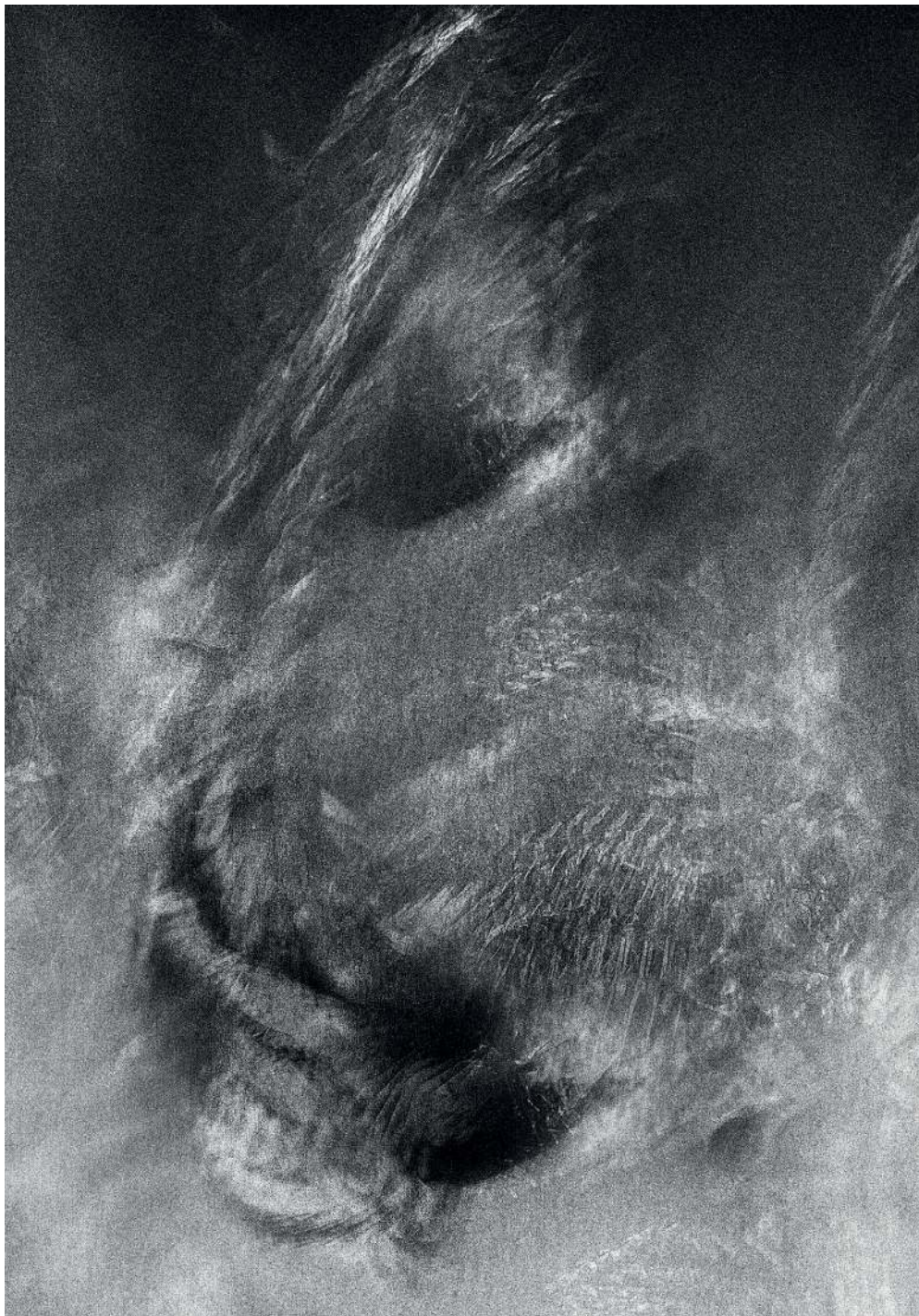
Kondensacja 07, 2020 druk pigmentowy

Condensation 07, 2020 pigment printing, 100x70cm