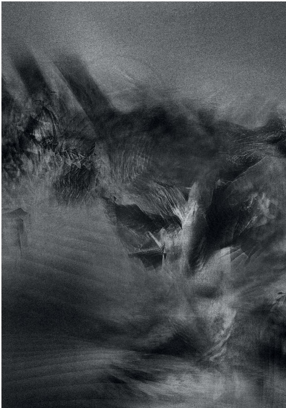
Kondensacja 12/2, 2020 druk pigmentowy

Condensation 12/2, 2020 pigment printing, 100x70cm