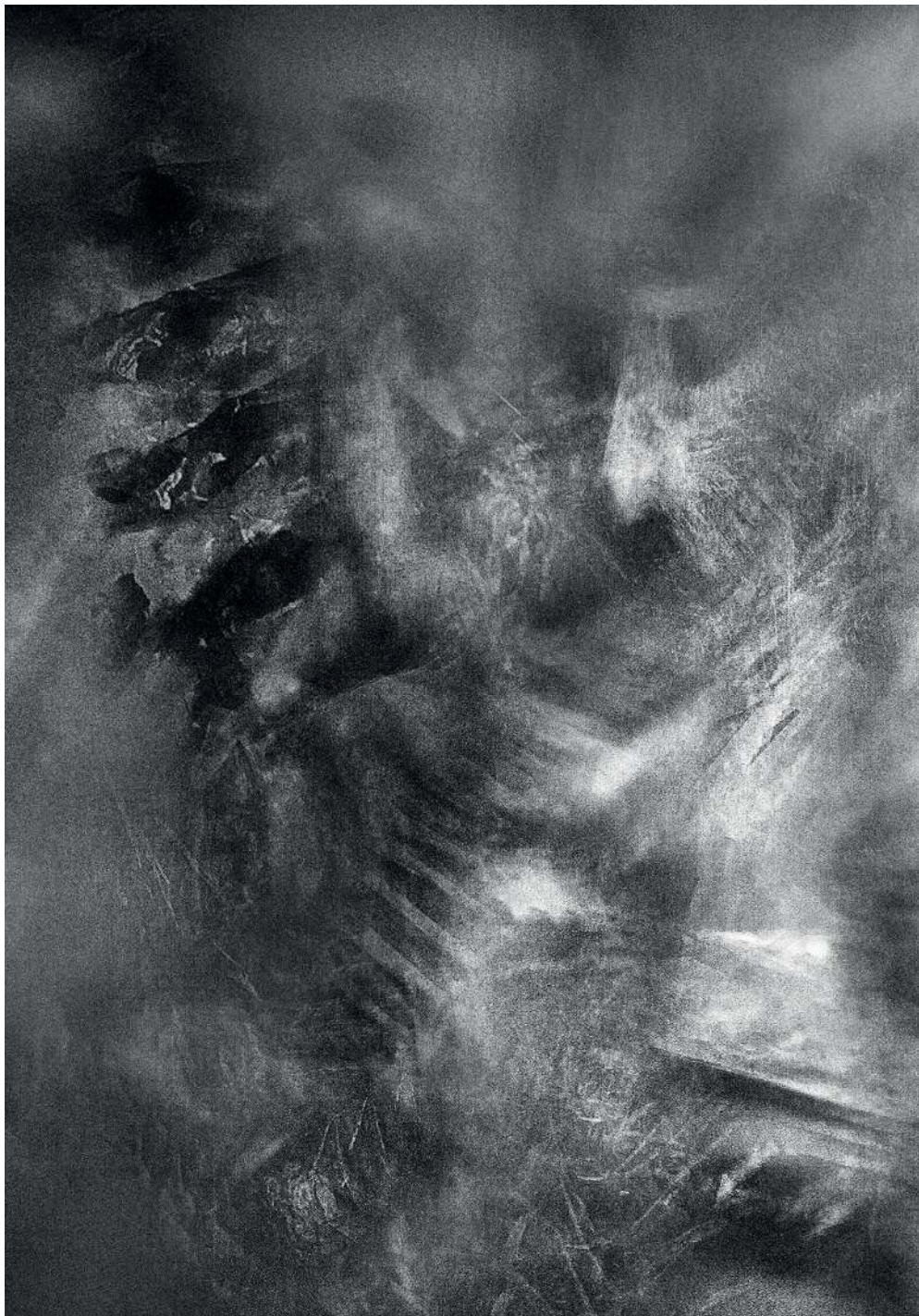
Kondensacja 03/2, 2020 druk pigmentowy

Condensation 03/2, 2020 pigment printing, 100x70cm