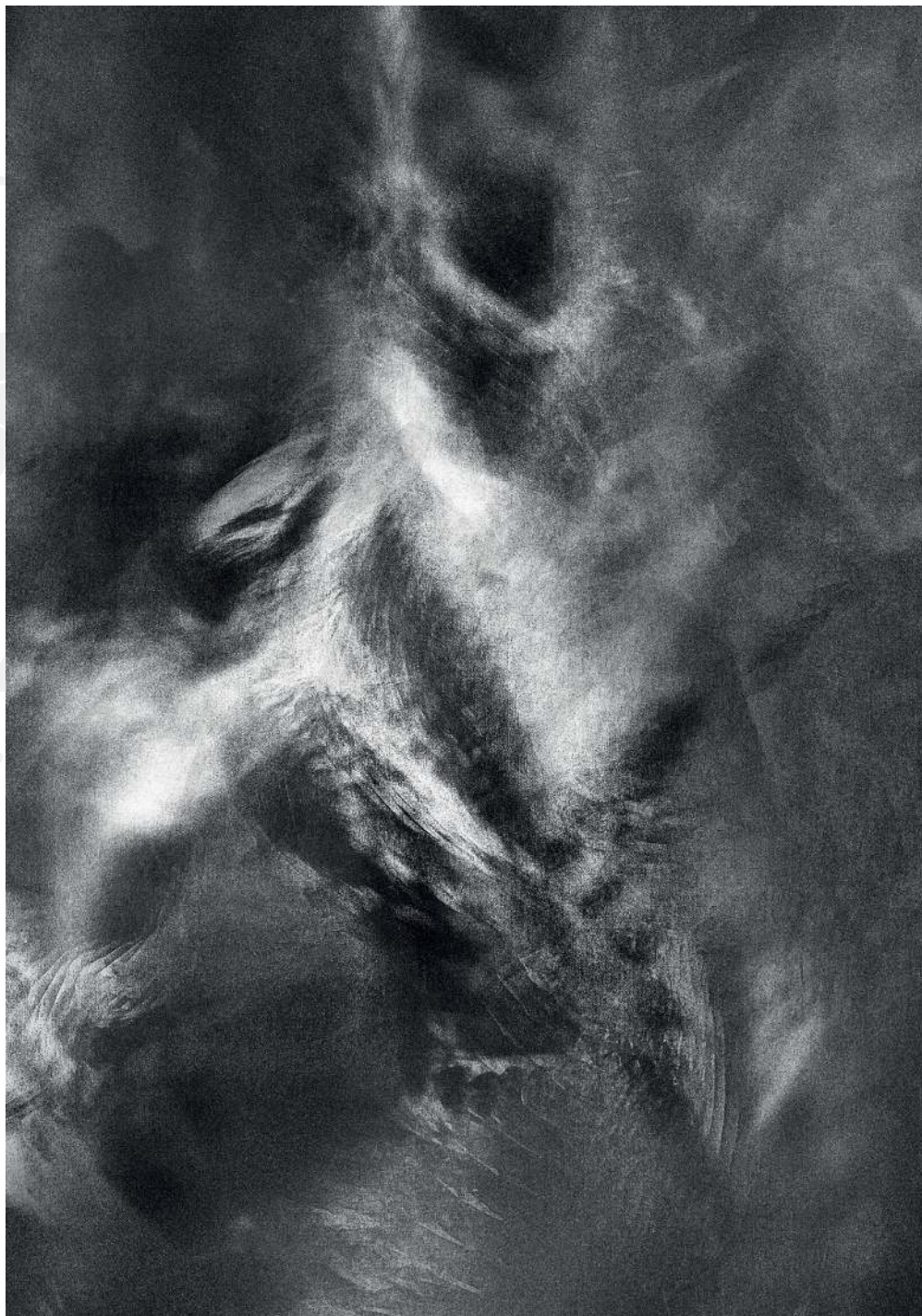
Kondensacja 02, 2020 druk pigmentowy Condensation 02, 2020 pigment printing, 100x70cm