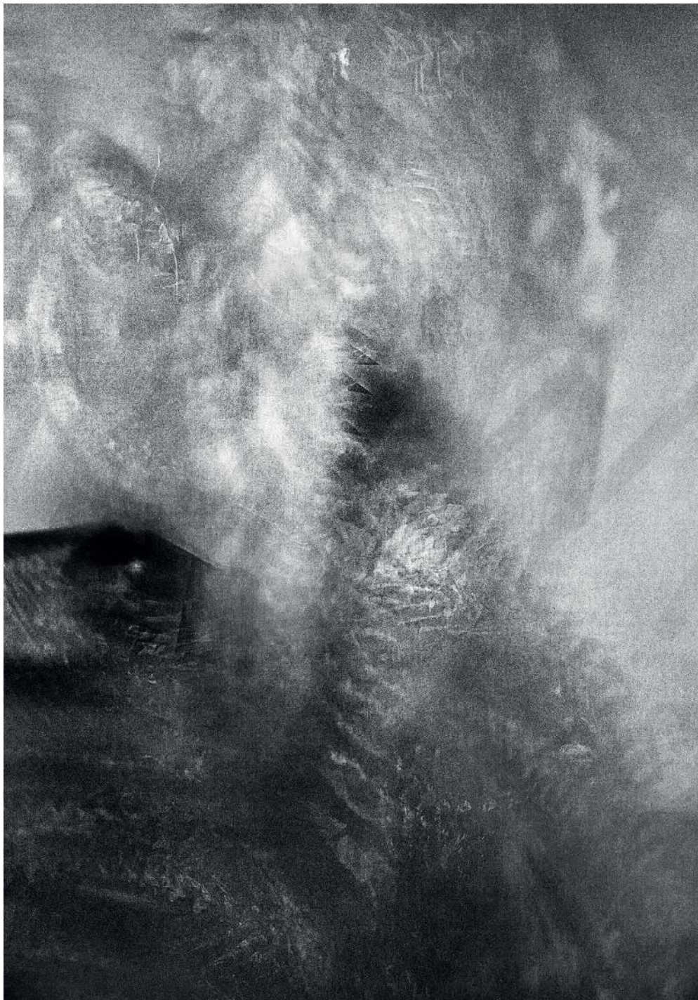
Kondensacja 04/3, 2020 druk pigmentowy

Condensation 04/3, 2020 pigment printing, 100x70cm