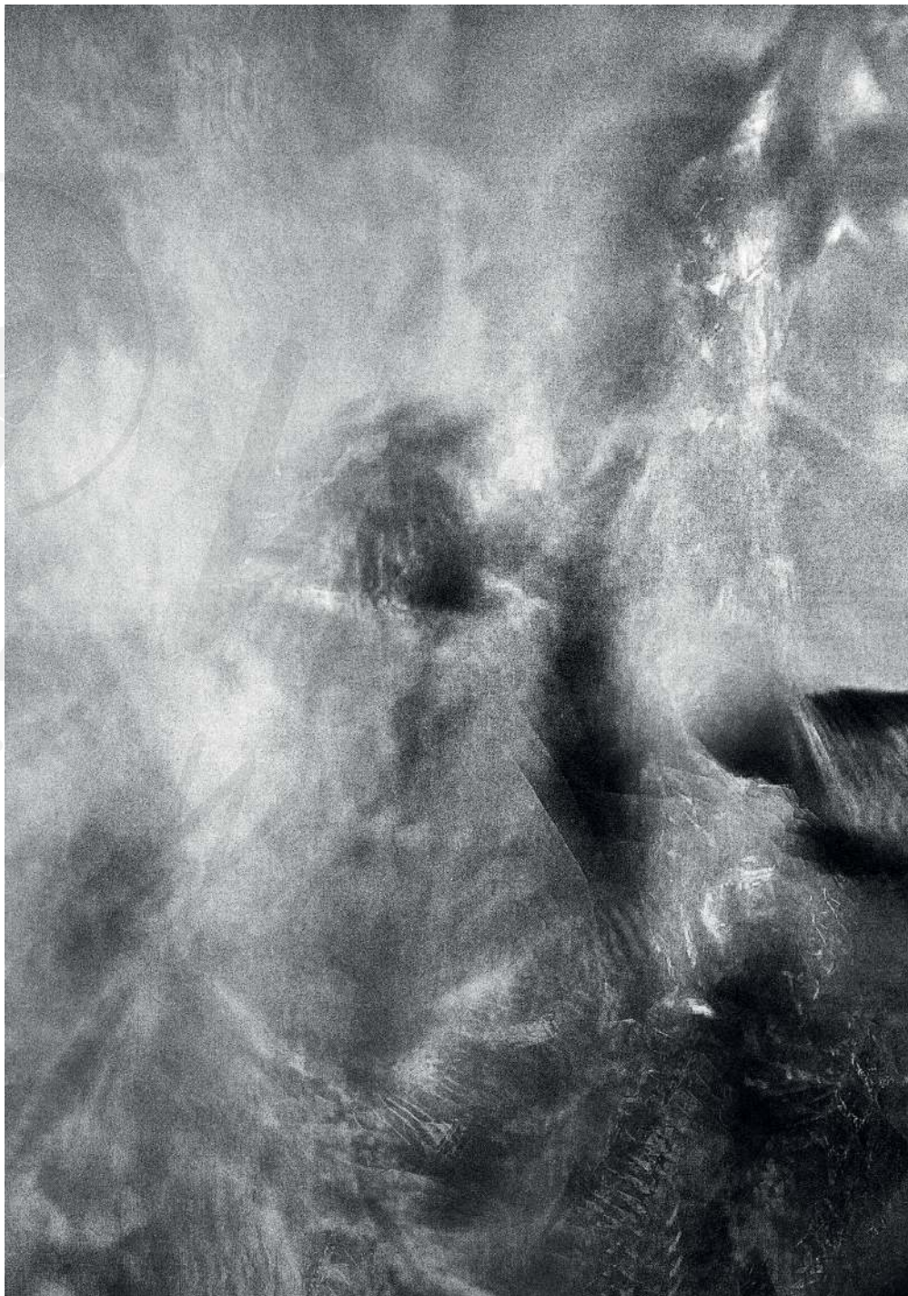
Kondensacja 04/2, 2020 druk pigmentowy Condensation 04/2, 2020 pigment printing, 100x70cm