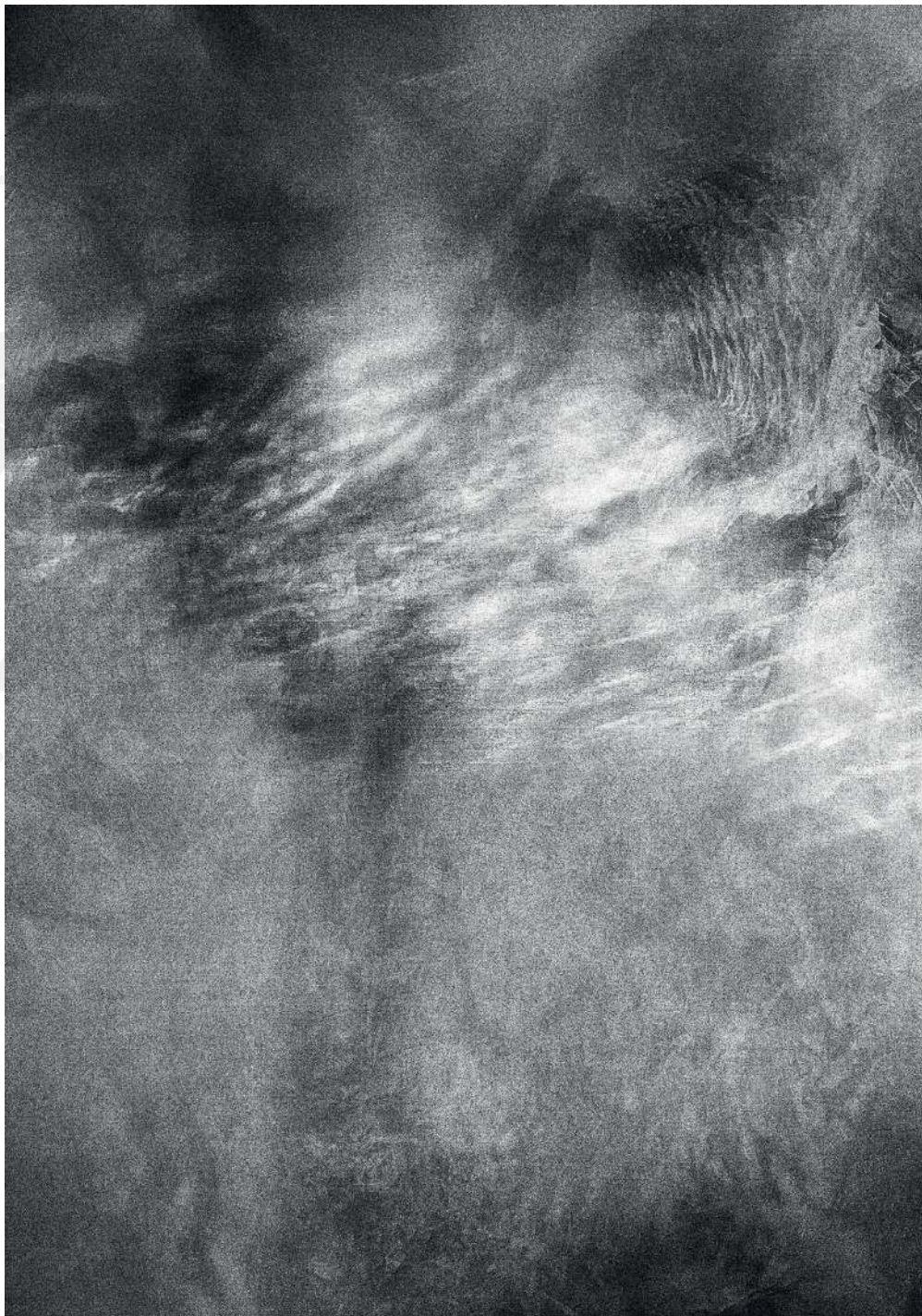
Kondensacja 01/2, 2020 druk pigmentowy Condensation 01/2, 2020 pigment printing, 100x70cm