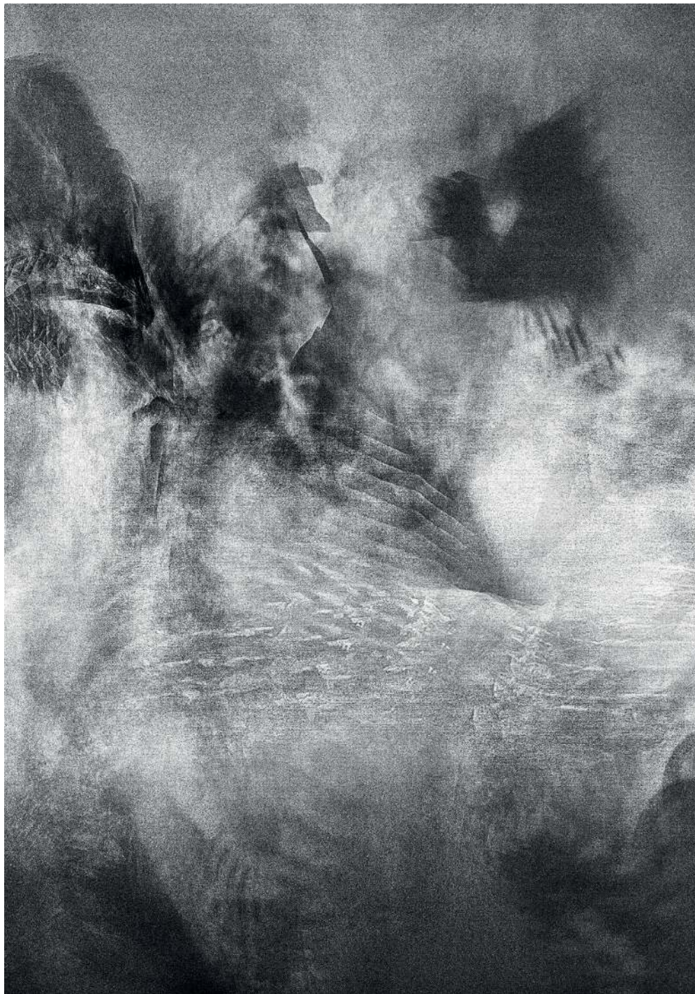
Kondensacja 01/3, 2020 druk pigmentowy

Condensation 01/3, 2020 pigment printing, 100x70cm