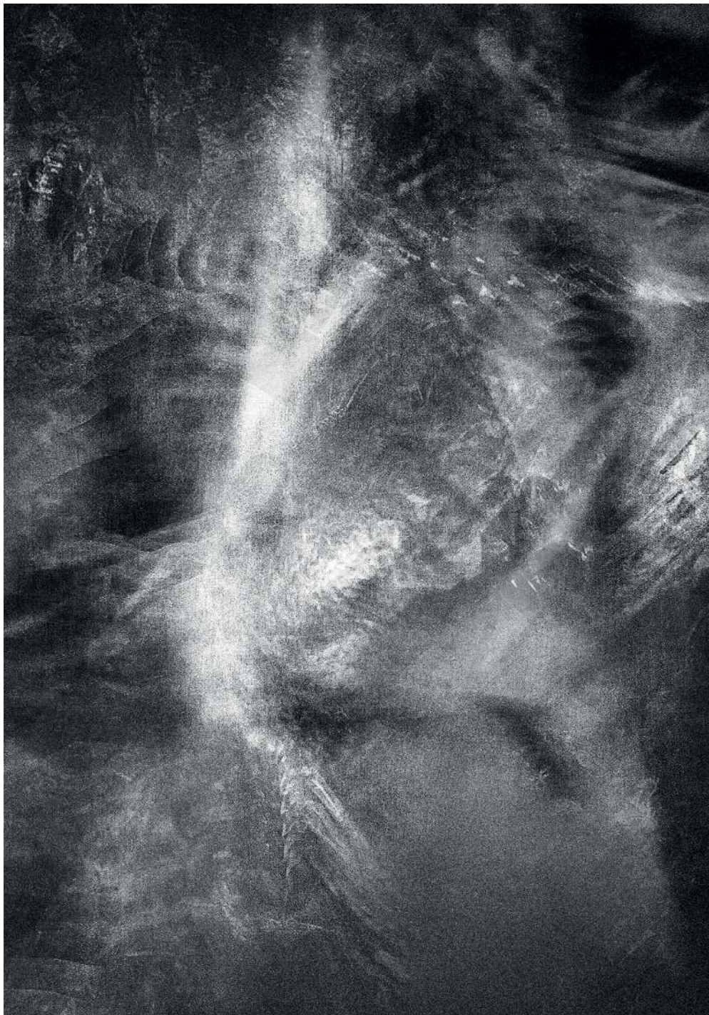
Kondensacja 11/3, 2020 druk pigmentowy

Condensation 11/3, 2020 pigment printing, 100x70cm